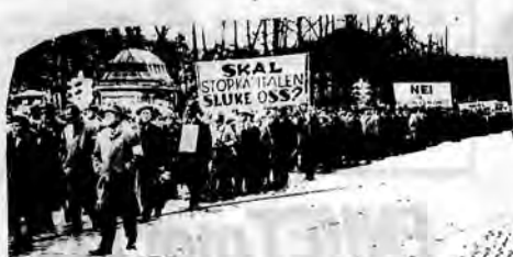
Arbeidere i kamp mot EEC i 1962. Kampen fortsetter i dag.

Hefene vil bli sendt umiddelbart i postoppkrav. Arbeiderkomiteen mot EEC og dyrtid, Boks 3829 Ullevål Hageby, Oslo 8, Postgiro 20 88 77.