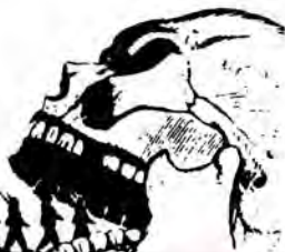
Egen EF-gruppe for atom- våpen-planlegging