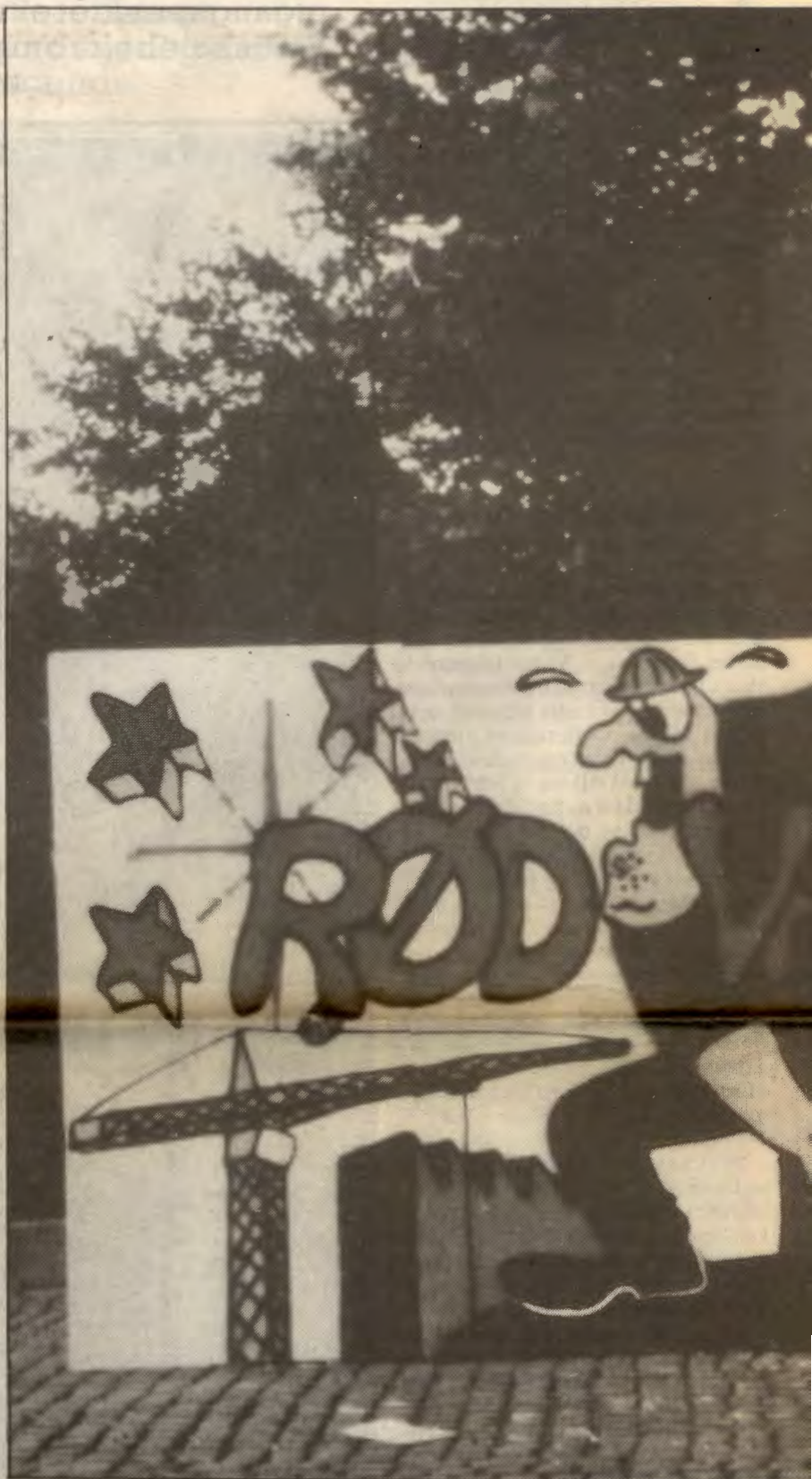
Det er ingen tvil om at RV har satt klare spor etter seg, ikke minst i Oslo som denne plameningene ditto.

Hvor viktig er det å ha et landsomfattende alternativ i 1991? betyr det rikspolitiske og NRK-dekning så mye at det må satses på ett alternativ? Eller vil det være riktig å stille RV-lister noen steder, Miljø og Solidaritet noen steder og reine lokale lister andre?