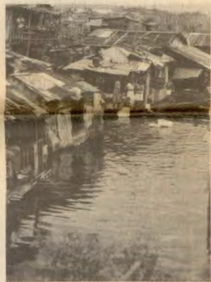
Beforholdene i slumområdene er ubeskrivelige. Bildet er fra flommen i San Miguel seinhøsten 1988.

Utgangspunktet for prosjektet er Metro-Manila, nærmere bestemt områdene Pasig, Mandaluyong og Taguig. Modellen skal overføres til andre deler av Filippinene, primært i prioriterte områder på landsbygda. St. Joseph jobber med å finne egne områder for utvidelse for prosjektet.