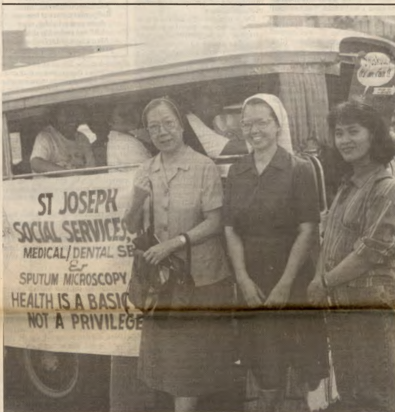
Kvinneutvalget i AKP har fått midler fra pengene som ble samlet inn ved årets TV-aksjon. 340 000 kroner skal brukes på et kvinneprojekt på Filippinene. Samarbeidspartner «St. Joseph Social Services».

Kvinneutvalget i partiet har fått innvilga omlag 340 000 kroner i støtte til et prosjekt på Filippinene. Prosjektet har flere delmål: Organisering av kvinner, utdanning av barfotleger og startkapital til kvinner for å bli sjølforsørgende.