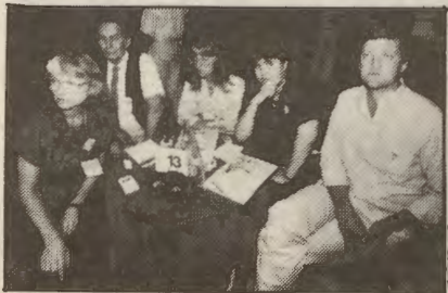
Det var ikke akkurat ellevevill glede å spore hos FMS-panelet under valgvaaka i TV-huset i høst, og nå går diskusjonene om valgalternativer for fullt.

Det legges opp til omfattende diskusjoner og undersøkelser i de nærmeste månedene for å komme fram til hvordan RV og AKP skal stille seg til valget i 1991. Det skal være diskusjoner i alle AKP-lag og RV-grupper, alle de ca. 3.500 personene som sto på RVs lister i 1987 skal snakkes med innen 1. februar, det skal være landskonferanse i AKP og 25.-27. mai blir det ekstraordinært landsmøte i RV.