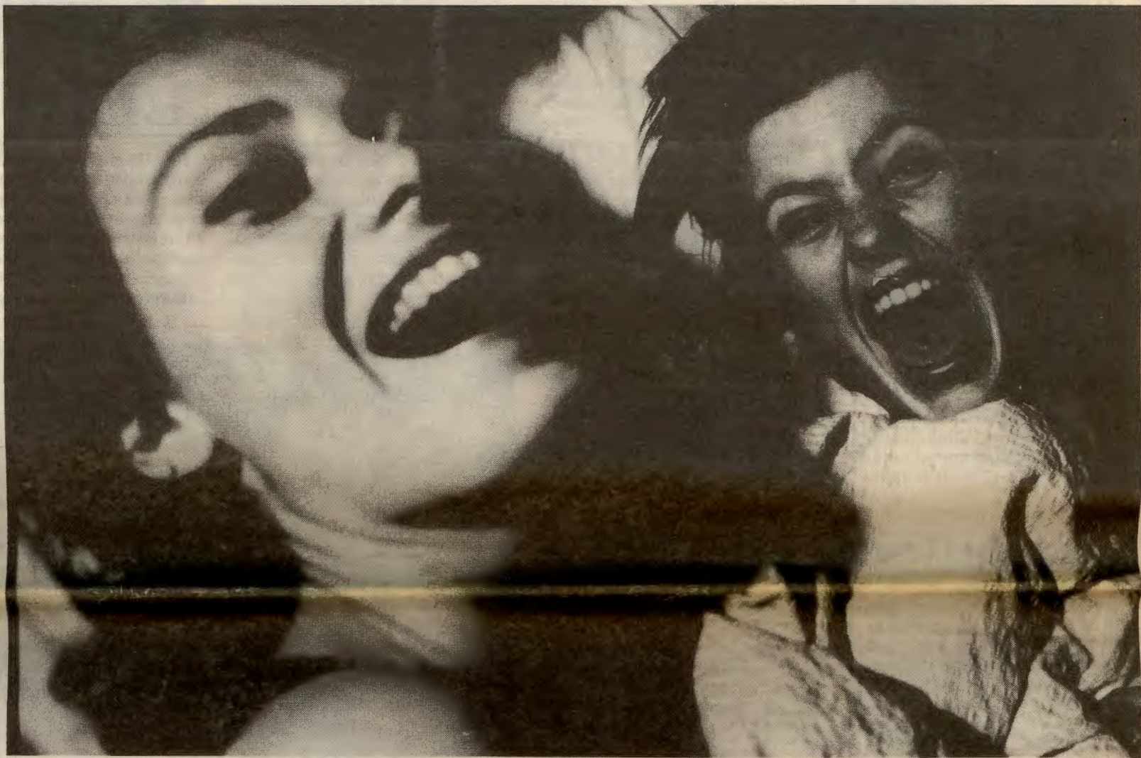
Opprør har snakka med en av medlemmene i det nystifta RU-laget i Haugesund. Og hun er ikke snau når hun forteller om den hjelpen de har fått for dra det hele i gang.