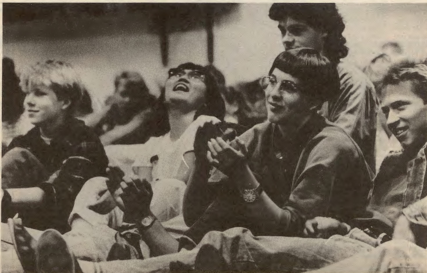
På skolevalg møtene får man en pekepinn på hvordan ungdommen står politisk. Tendensen er en tydelig radikalisering blant ungdom. Bildet er fra et skolevalg møte i Larvik i '89. Etter mye jobbing er det nå blitt RU-lag i byen.

Valget viste oss helt klart at ungdommen radikaliseres og at 80-års jappekultur og egoisme er på vei ut. Valgforskere er også enige om at 16-åringene er mer radikale enn 18-åringene. Skal RV bli en levende, spennende og fram for alt levedyktig allianse, er det avgjørende å få trukket med ungdommen. Hvordan gjør vi det?