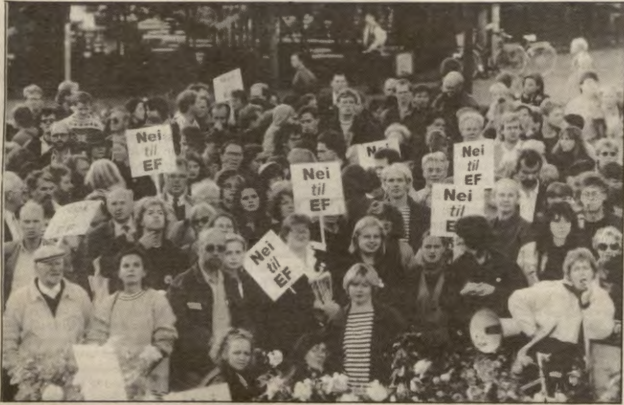
AKP vil jobbe i nei til EF-bevegelsen for å få gjennomslag for parolen «Nei til EØS» som den sentrale oppgava i EF-motstanden idag.

Landsstyret har fatta vedtak om kampen mot EØS-avtalen. Uttalelsen som er gjengitt på denne sida streker opp partiets linje. Her følger noen punkter fra vedtaket om partiets arbeid.