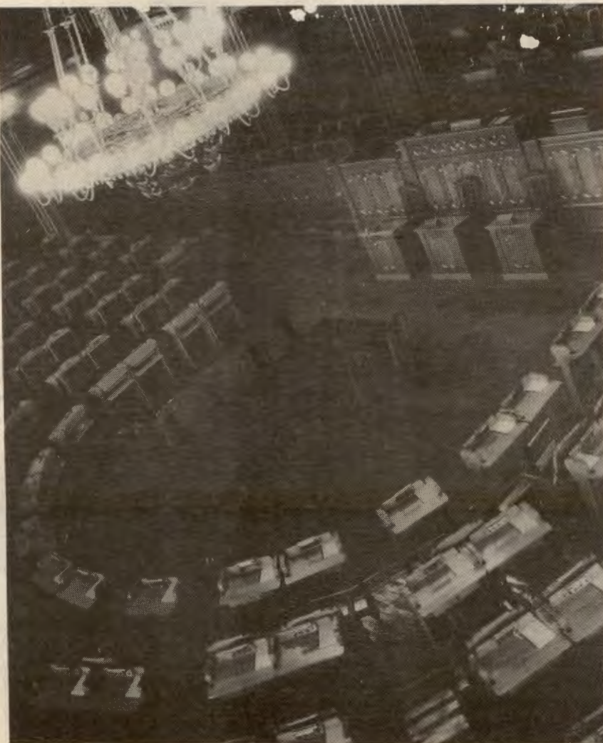
Det bør nå diskuteres grundig i RV og AKP om hvilken betydning det vil ha om RV får stortingsmandat, og hva det vil kreve, skriver Aksel Nærstad.

RV har alltid fått mindre stemmer ved stortingsvalg enn ved lokalvalg fordi folk stemmer mye etter å få valgt inn folk. FMS-resultatet var det beste stortingsresultatet vi har hatt, men også da var det langt fram til mandat.