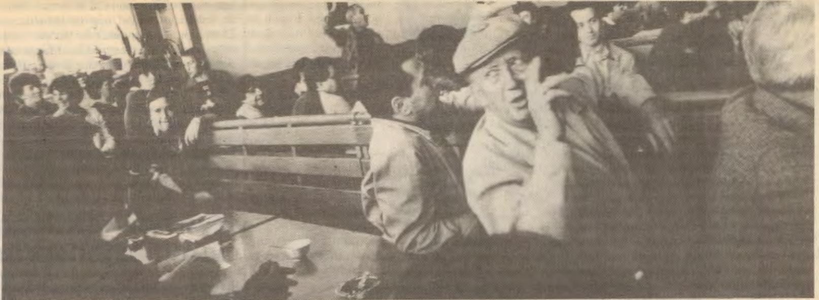
I desember ble det arrangert eit møte om EØS for RV- og AKP-medlemmar. Møte la vekt på viktigheten av å påvise og reise kamp mot konkrete EØS-førebuande tiltak som rammar arbeidsfolk og fagrørsla. Og arbeidet med å få fram ein alternativ politikk for fagrørsla utafør EØS og EF.

2. Frå no av må det leggjast stor vekt på vinne tilslutning til «Nei Til EF» sitt faglege opprop frå medlemmar, tillitsvalde og flest mogleg organisasjonsledd. Oppropet bør gjerne drivast fram til ca. 15. april og presenterast i avisannonser og nyttast i 1. mai-mobiliseringa. T.d. kan kvar organisasjon som sluttar seg til, sende 10