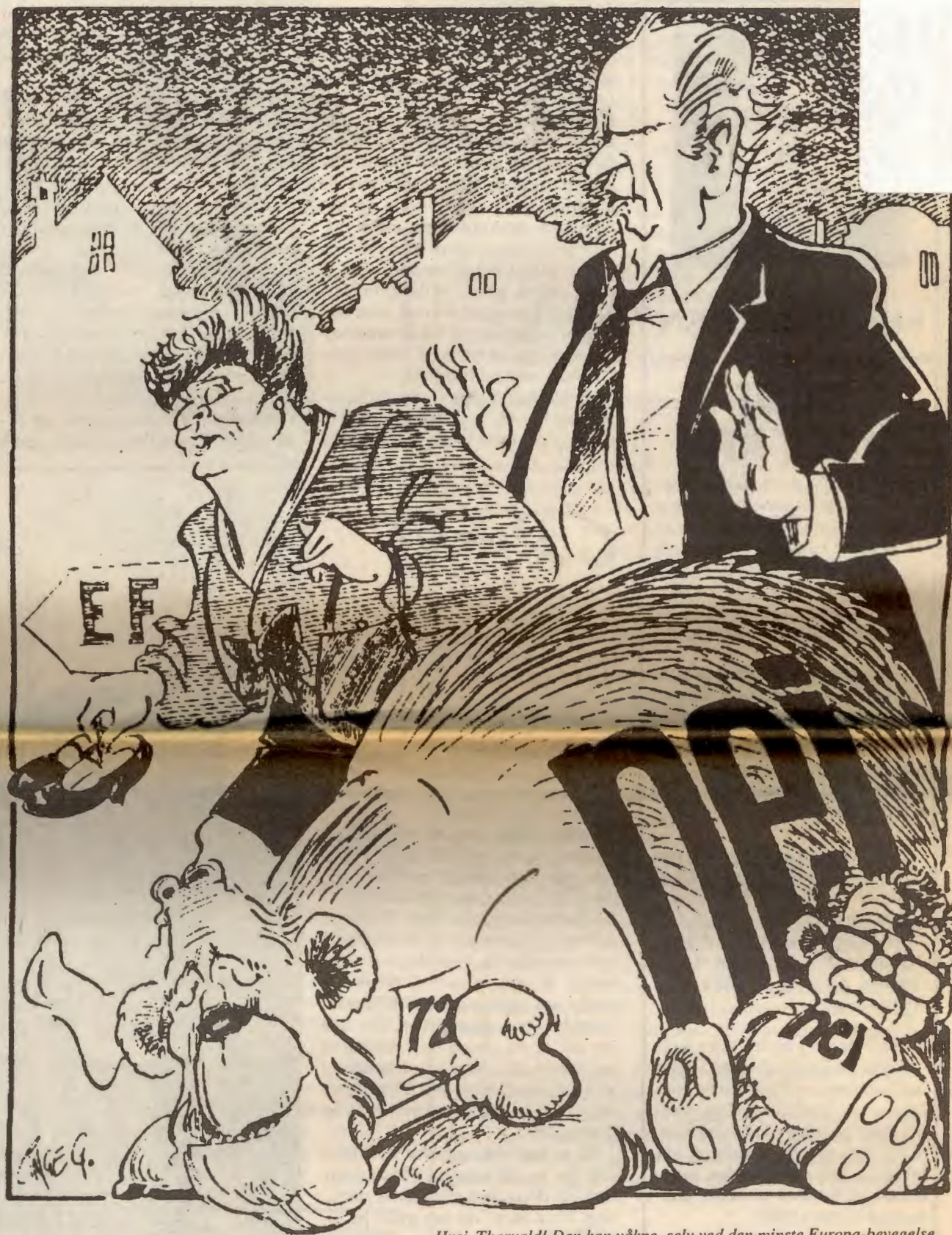
Hysj, Thorvald! Den kan våkne, selv ved den minste Europa-bevegelse...