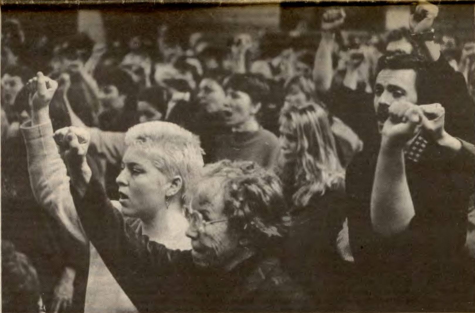
Hva blir viktigst på Rød Valgalliansens landsmøte? Bildet er fra AKP's kvinnekongress for noen år tilbake.

Hva er det som er viktigst? Hva er det størst uenigheter om og viktigst å få avklart standpunktene på? Det er nettopp disse diskusjonene som vil legge grunnlaget for mye av hva som vil stå i folkus på landsmøtet. En av de viktigste oppgavene til landsmøtet er å velge en ny ledelse. Den bør gjenspeile organisasjonen, ha brei tillit og evne å lede RV framover etter de retningslinjene landsmøtet legger opp. Hvem ønsker dere inn i ledelsen? Hvordan bør den se ut?