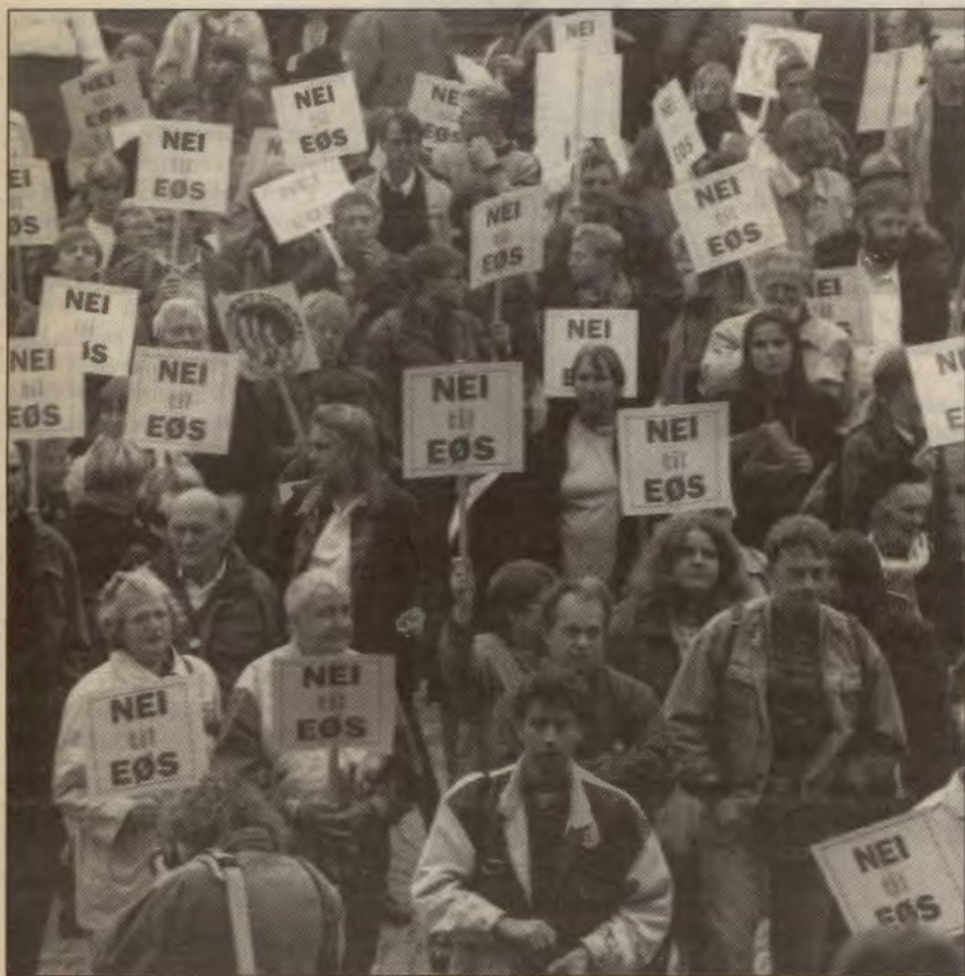
Fra demonstrasjon mot EF.....