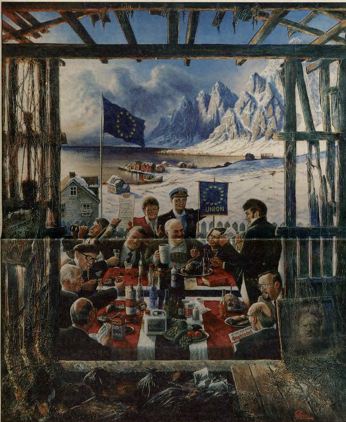
Maleri av Rolf Groven

Gudrun Høyerstad Høysestervn. 50 a 0768 Oslo