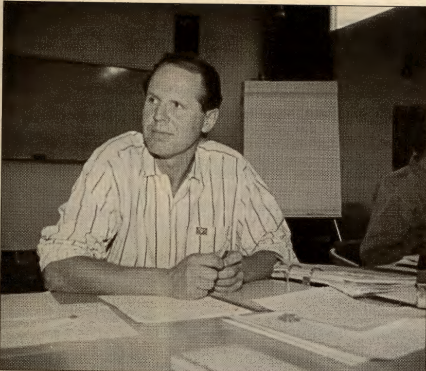
RVs leder ber oss alt nå å tenke på å stille lister.

Forslag bes sendt til Nominasjonskomiteen, RV, Gøteborggt. 8A, 0566 Oslo.