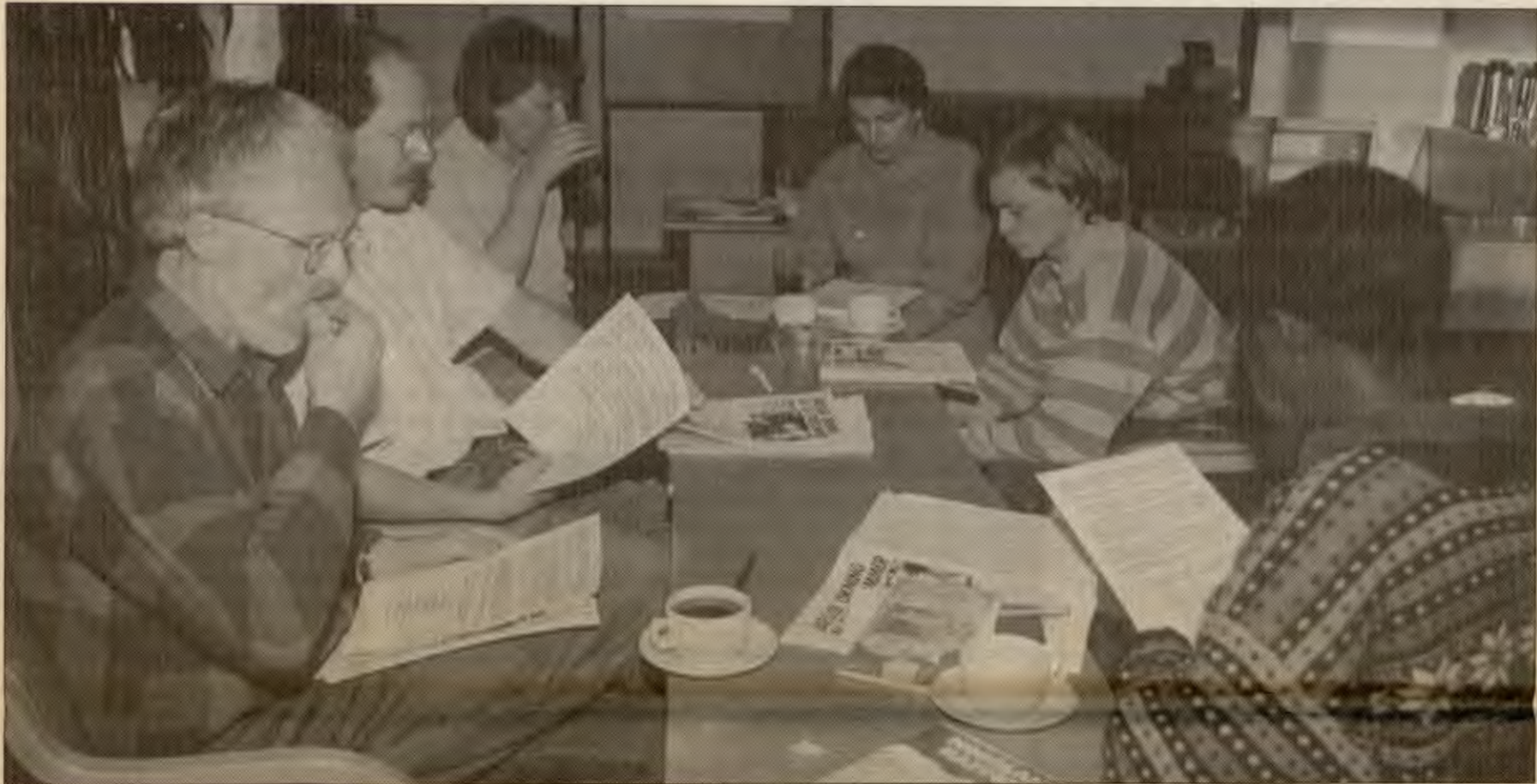
Fra møtet i Bodø.

RVs landsstyre har oppfordret til flere slike opprop fra kommunestyremedlemmer mot EU. Det er kanskje lettere å få til enn vi tror?