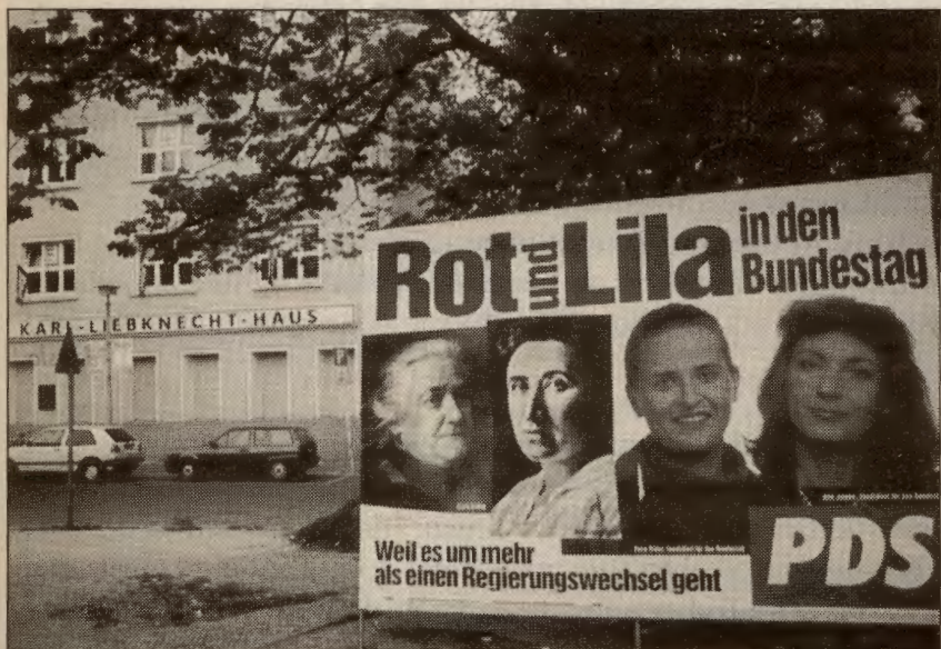
Fire tyske kvinner som så og ser seg selv som kommunister. Til venstre på plakaten: Clara Zetkin og Rosa Luxemburg foran Karl Liebknecht-haus i Berlin, i dag hovedkvarteret til PDS.

P.S.: De andre ml-organisasjonene ble etterhvert også oppløst. KPD/ML skiftet navn til KPD og sluttet seg noen år seinere sammen med den trotskistiske «Gruppe internasjonale marxister» til den ubetydelige lille gruppa «Det forente sosialistiske parti». Et unntak er MLPD, som etter navneskiftet fra KABD til og med økte litt og fortsatt bygger partiet i sin økonomistiske verden — i tråd med det de alltid gjorde ved siden av de virkelige politiske bevegelsene. Ingen av disse partiprojektene spilte en rolle i en antatt eller reell «omgruppering».