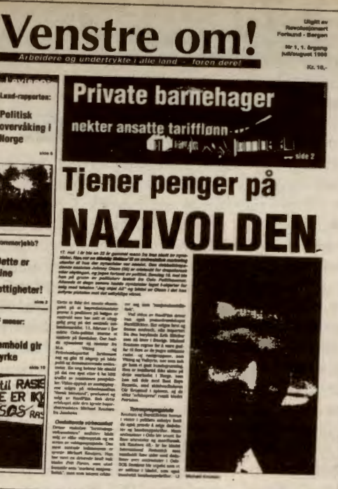
Dristig: Revolusjonært Forbund i Bergen gjev ut «Venstre om!» (faksimile)

Vidare kan vi læra om RF sitt syn på frontpolitikk, der «samhold gir styrke» er parola. Rapport frå felles RF/RU pinseleir i Bergen, reklame for RF og RV-møte, og ei trailerhisto-