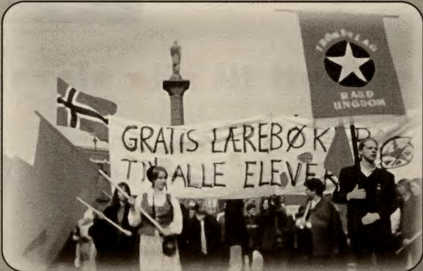
1. mai, Trondheim 1996