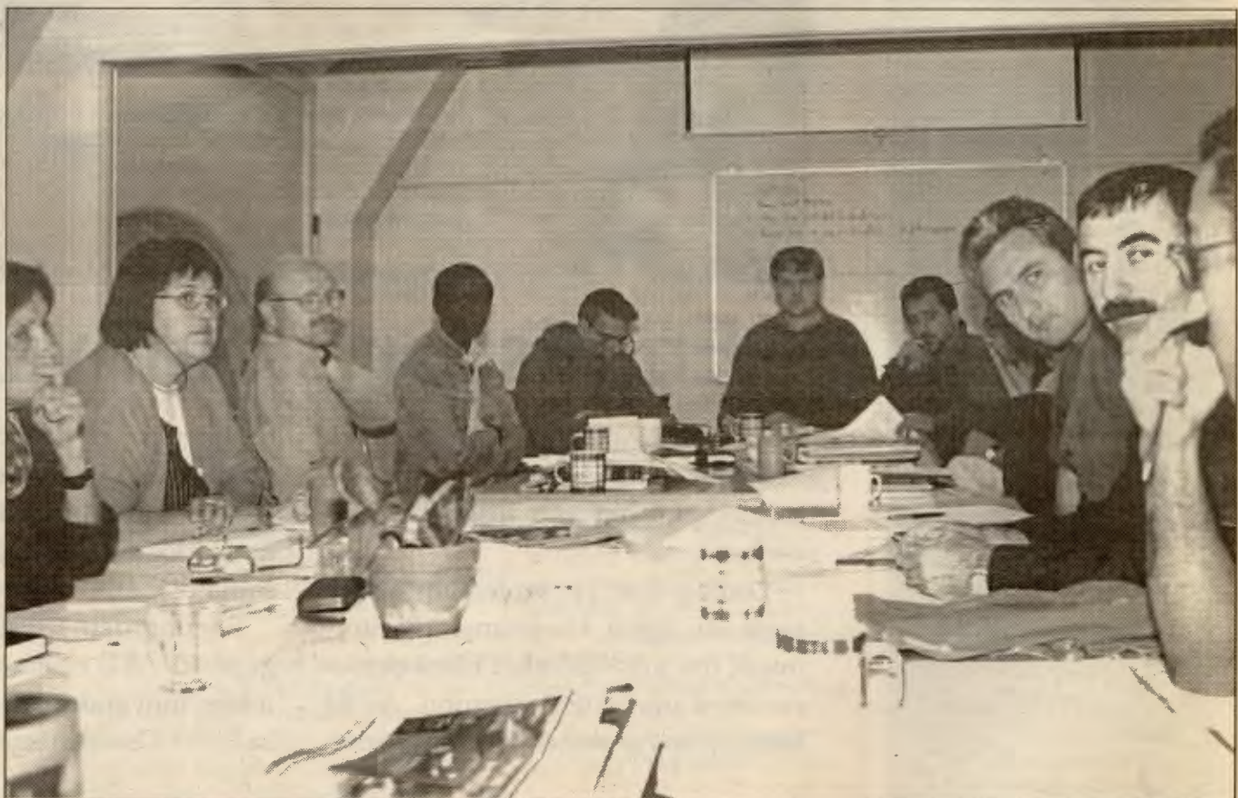
Vellykka møte: RVs innvandrer møte var et av tre vellykka tiltak.