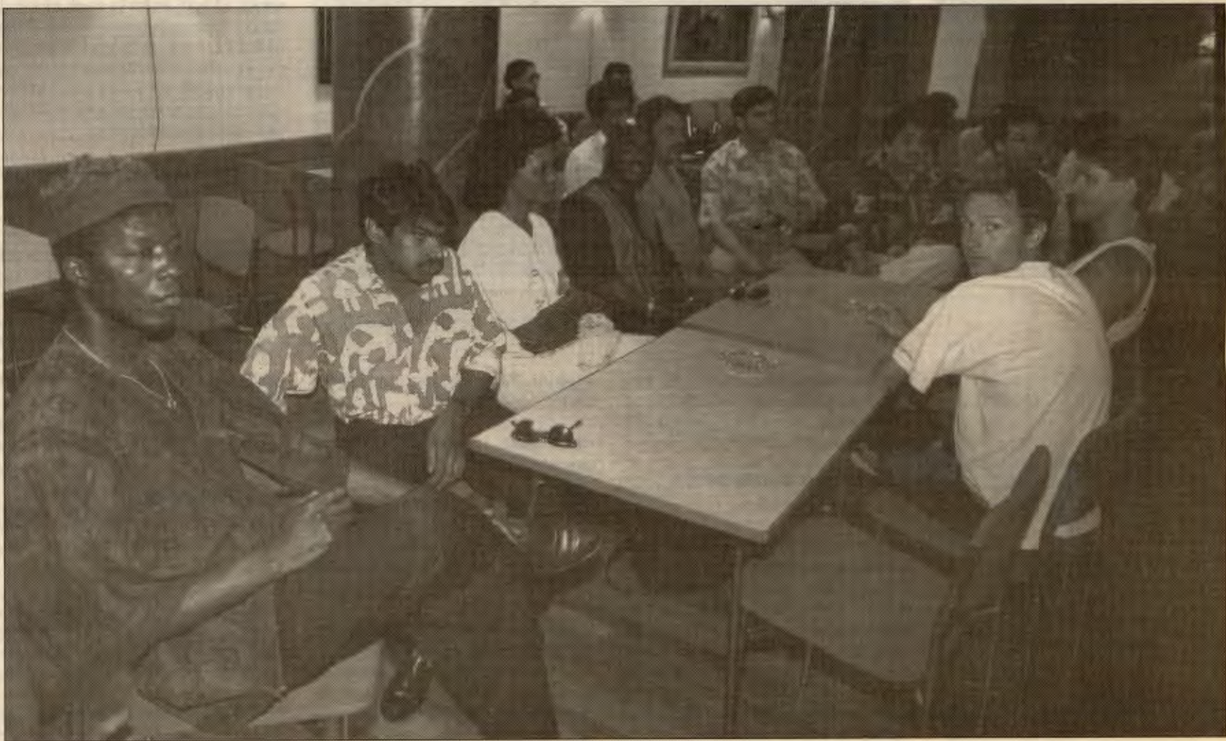
Et streikemøte på SAS-hotellet. Det var en flerkulturell streik!

Skal RV utvikle sin betydning som et anti-rasistisk parti med målsetting om et flerkulturelt samfunn, er det nødvendig at partiet sjøl blir mindre «hvitt». Det er viktig å oppsummere de erfaringene medlemmer med innvandrerbakgrunn har i partiet, utvikle partiets minoritetspolitikk, verve flere medlemmer med innvandrerbakgrunn, velge flere innvandrere i tillitsverv, få flere innvandrere til å stille på valglistene, øke den sosiale kontaktflaten med innvandrer miljøer - og styrke arbeidet i de anti-rasistiske organisasjonene - og i organisasjoner og nærmiljøer med mange innvandrere. Det er også viktig å styrke de anti-rasistiske sidene ved annet arbeid - f.eks. i fagbevegelsen og kvinnebevegelsen.