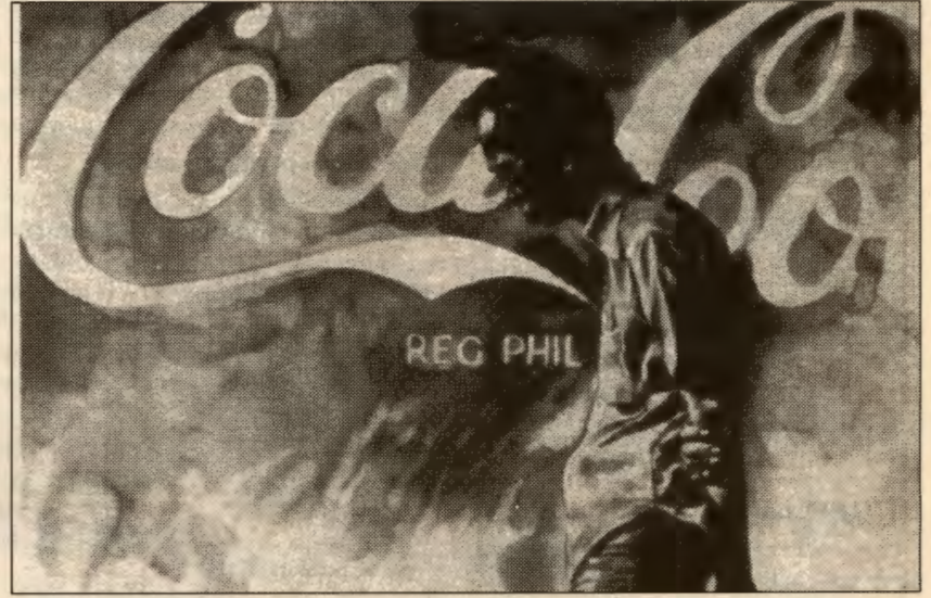
- Den systematiske rasisme er et barn av imperialismen. Her imperialism slik den filippinske kunstneren Antipas Delotavo ser det.

Den statlige rasismen produserer rasistisk ideologi som danner basis for de fordommene som Hagen/FRP utnytter. Det er et nøkkelspørsmål i den anti-rasistiske kampen å avsløre