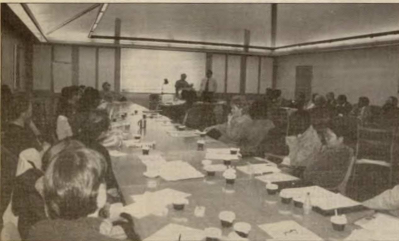
Fra konferansen som RVs innvandrerrutvalg tok initiativ til.

- LS har merka seg en rekke forslag fra deltakere på partiets innvandrerkonferanse som tar sikte på å gjøre RV til "et mindre hvitt". Disse forslaga vil bli behandla grundig og seriøst.