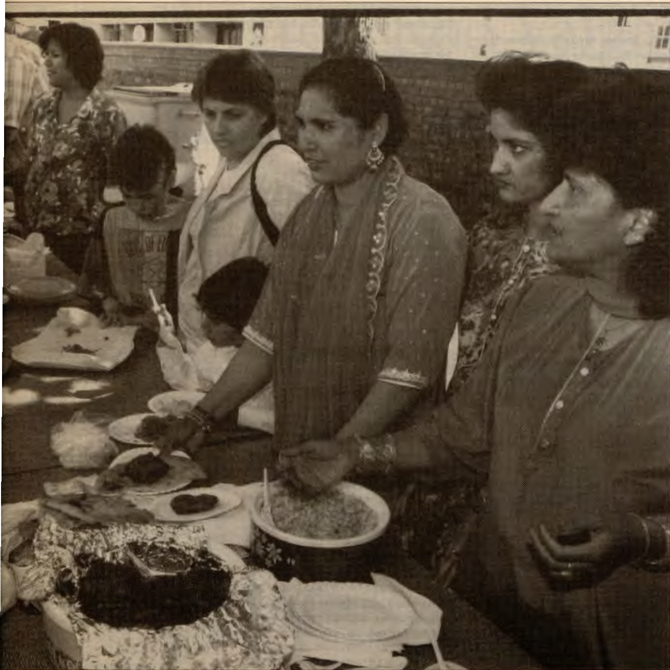
eres dette i manifest-utkastet?&lt;