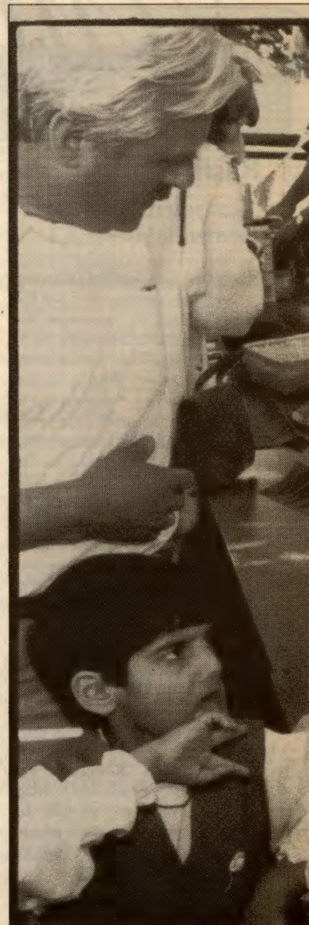
- Kvinnene er kulturbærerne i familien.

Undersøkelser har vist at innvandrene fra den 3. verden har langt større problemer enn nordmenn med å komme inn på det ordinære arbeidsmarkedet. Den offisielle arbeidsløsheten i minoriteter med bakgrunn fra 3.verdenland er på mer enn 20% (1996), og arbeidsløsheten er også stor blant arbeidssøkende med høyere utdanning og gode norskkunnskaper. RV vil bekjempe diskriminering på arbeidsmarkedet gjennom at: