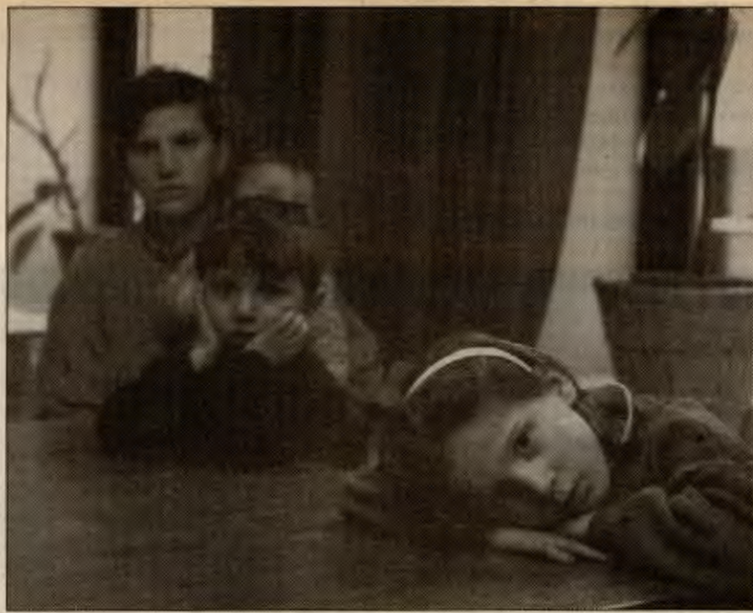
Kirkeasyl - den norske regjeringas grove tortur av mennesker og spesielt barn.

innvandrere og folk med innvandrerbakgrunn, slik at flere av dem får mulighet til å bli ansatt i det offentlige. Målsettinga må være at andelen ansatte fra minoritetene avspeiler andelen deres i befolkninga. RV-representantene forplikter seg til å reise forslag om dette.