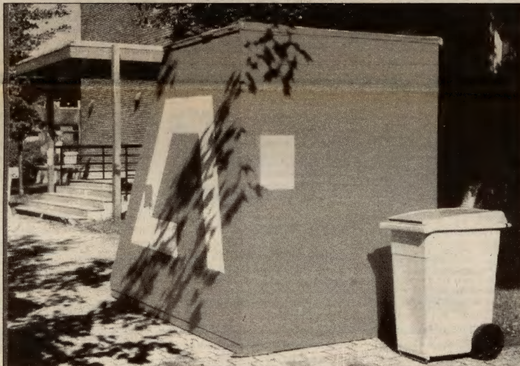
Det norske hus etter overvåkingssvøringene?

For det andre fordi overvåkinga av NKP slett ikke var noe ukjent fenomen, for ikke å snakke om at historia forøvrig er full av eksempler, og for det tredje fordi det fort dukka opp konkrete eksempler på overvåking i forskjellige former.