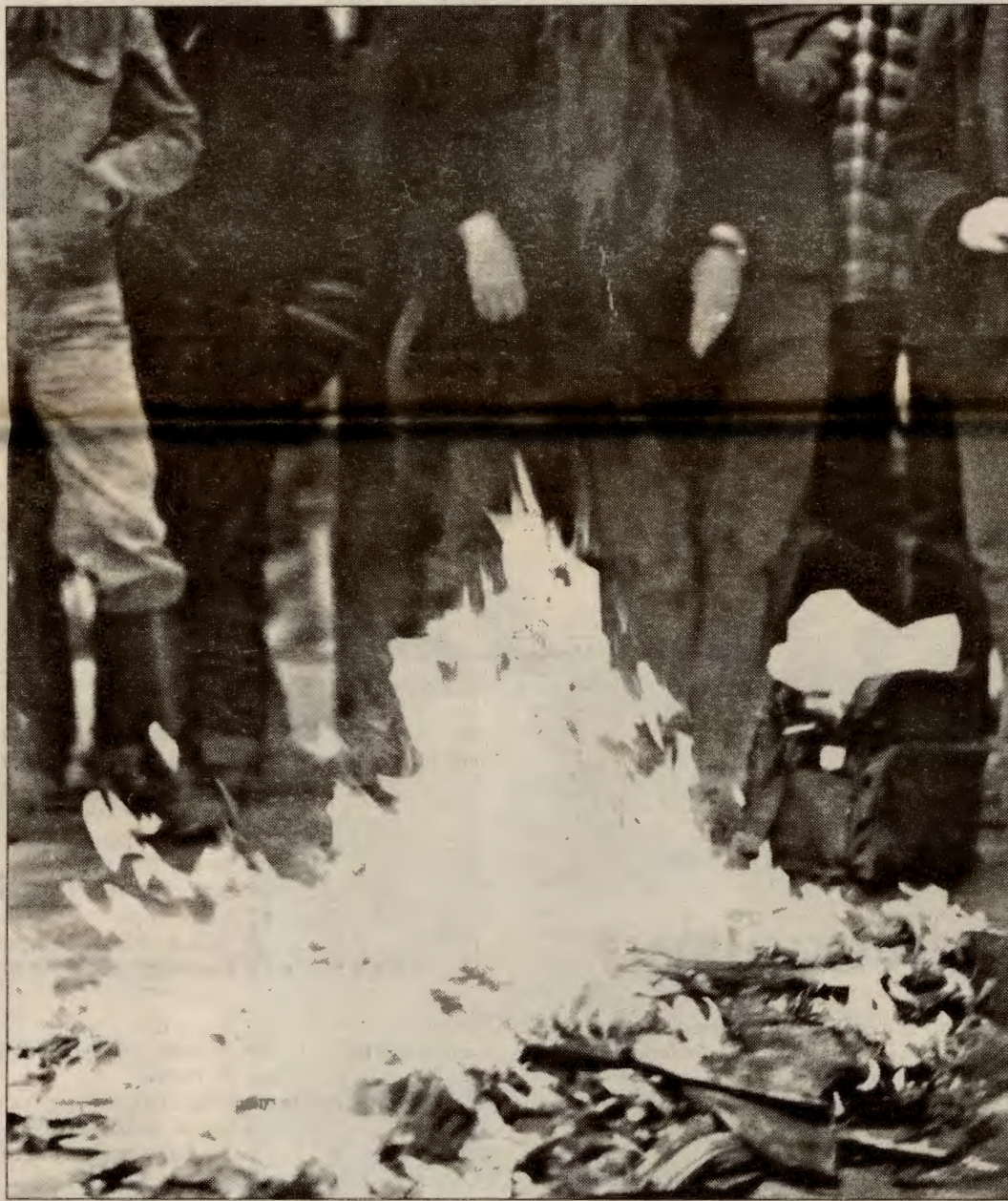
Fra et av de mange pornobål kvinnebevegelsen har laget opp i gjennom tidene

Det er ikke pessimistisk å forestille seg norske kvinner til salgs i campingvogner i Sibir. Det er logisk å spå "red light districts" i alle de store norske byene. Det er sannsynlig at mange flere kommer til å finne bilder av søstre og venner i pornobladene i Narvesenhyllene, og at flere av naboen får seg postordre-koner og drar på sex-turer til Øst-Europa og Asia.