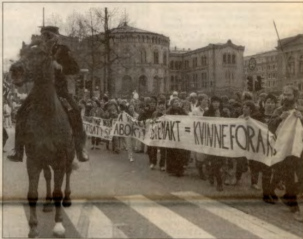
Kvinnbevegelsen må samles og mobilisere massene.

Resultatet dersom LO vinner fram, noe som gjerne kan skje, er at vi kan få arbeids-tidsordninger som diskriminerer kvinner i enda sterkere grad. Fleksibilitet vil bety at ingenting lengre er unormalt, slik at tilleggene for ubekvem arbeidstid også vil forsvinne.