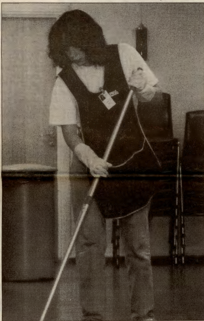
Kvinner er overrepresentert i lavtlønnsyrker

Vi kommer ikke utenom å spørre åssen det er å være kvinne i RV. Med den debatten gutta fører på KK-forum, er det ikke særlig fristende å stik-