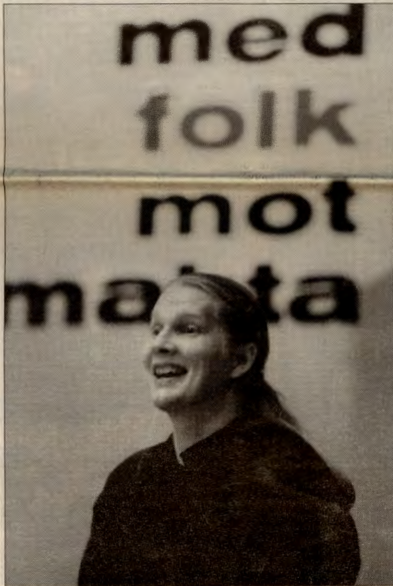
Den nye leiaren i Raud Valallianse tek partikulturen på alvor, og vil tilrettelegga for at forhalda for kvinner skal bli betre.