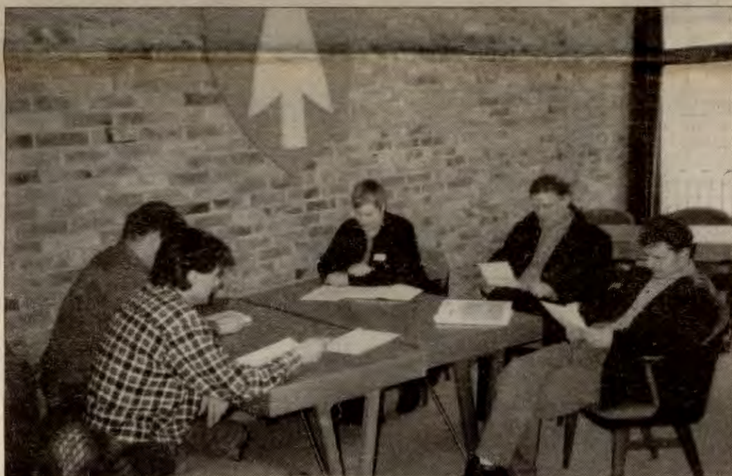
Begge dager var det satt av tid til gruppearbeid der man diskuterte aksjonsrettede planer