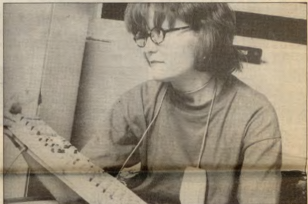
Fra et av de mange pornobål kvinnebevegelsen har laget opp i gjennom tidene

kurs i internett for jenter, litt etter “bøllekurs-modellen”. Tanken var at på et kurs med bare jenter, ville terskelen bli mindre for å tørre å spørre “teite” spørsmål. Interessen var enorm! Typisk nok var det bort i mot umulig å få tak i en kvinnelig lærer til kurset. Men vi vet jo at et slikt kurs i regi av kvinnegruppa selvfølgelig ikke er noe mer enn en dråpe i havet. Derfor vil vi prøve å følge opp prosjektet på en litt annen måte i vår, gjennom å presse fakultetene på universitetet til å selv ta ansvar for å arrangere slike kurs.