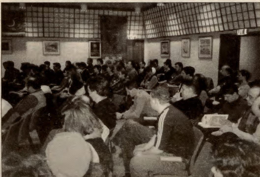
Fra fagforeningssalen i Odda kommune