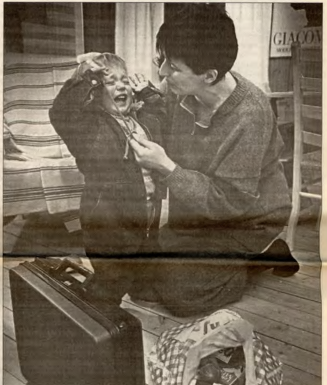
Kvinner tilbake til hjemmet med kontantstøtten

Kontantstøtten foreslås gitt til familier som ikke benytter seg av omsorgs-