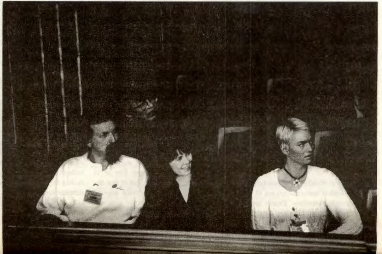
Ledelsen i LFF – bør ikke disse ha rett til å streike og danne tariffavtaler uavhengig av LO.

100 000-vis av arbeidere streiker i Sør-Korea mot nye lovforslag som vil undergrave fagforeningenes kamp. Streikeledelsen har gått i kirkeasyl og det er utsatt arrestordre på dem. Er det noen sammenheng mellom forslaget om å begrense organisasjonsfriheten, den såkalte arbeidsrettsrådets innstilling, i Norge og streikekampene som nå raser i Sør-Korea?