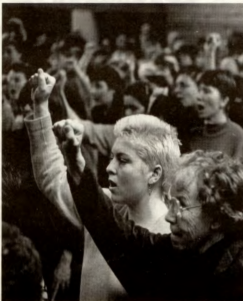
Kvinner diskuterer filosofi og praktisk politikk i Trondheim 10. - 11. oktober

Sør-Trøndelag RV har et levende kvinnepolitisk miljø, som nå også har fått noe lønnsmiddler fra RV for å drive kvinnearbeidet videre. Derfor var det naturlig å legge RVs store kvinnekonferanse til Trøndelags hovedstad. Konferansen finner sted 10. - 11. oktober.