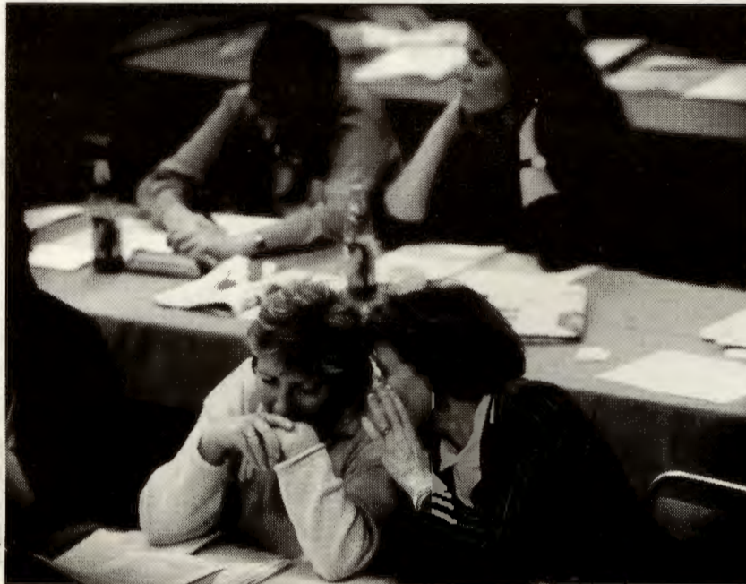
Her fra Kvinner på tvers-konferansen i september 1995.

Kan det være at det går så sakte framover med kvinnelønna fordi kvinner rett og slett har alt for lite makt? Dette er blant de tingene som blir diskutert under Kvinner på Tvers-konferansen 19. og 20 september.