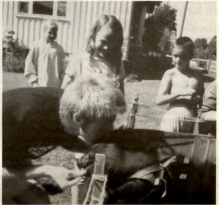
Mass kysser gris.

Sett av ei uke i juli neste år, så er du sikker på at du ikke går glipp av Rød Front-leiren.