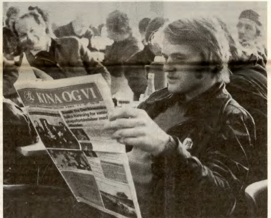
Du studerer vel? Denne karen ser i alle fall ut til å ha funnet mye spennede...

Mye av dette må vi gjennom likevel – og tilbud om studier på aktuell politikk kan mange steder være viktig for om vi få til kommunevalglistene – eller for om vi skal greie å videreutvikle det kommunalpolitiske arbeidet vårt.