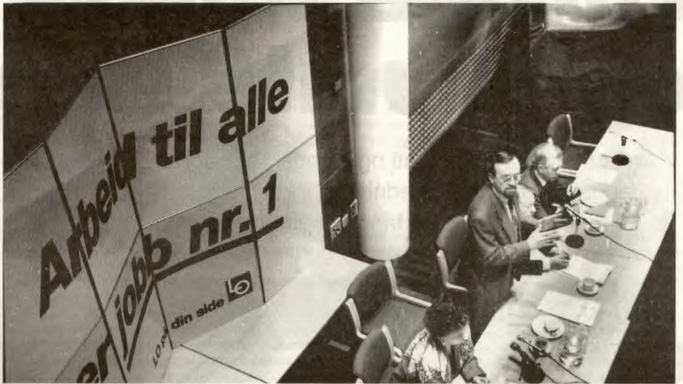
Arbeiderne må stå sammen, selv om man kan mislike LO-toppene til tider.

Hvis vi tenker på verdiloven og kravet til maksimalprofitt (kapitalakkumulasjonen) er det lett å forstå dette resonnet. Men i praktisk anvendbar politikk betyr det altså at det særegne ved borgerskapet ikke er deres felles klasseinteresser, men tvert imot at det er en klasse med innbyrdes motstridende interesser. Dette medfører i neste omgang at flere partier uttrykker borgerlige klasseinteresser, alliansene skifter og ulike deler av borgerskapet vil ha forskjellig linje for eksempel i forhold til klassesamarbeid med fag-