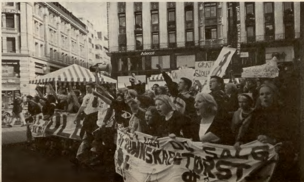
Det nytter å kjempe for en bedre skole. Fra høstens demonstrasjoner for gratis lærebøker.

Istedenfor oppussing av skolebyggene og små klasser ser det ut til at det er rasjonalisering og reformene til Hærnes som er trenden. Men det nytter å kjempe i mot – det har foreldrene og elevene ved Nordtvedt skole vist.