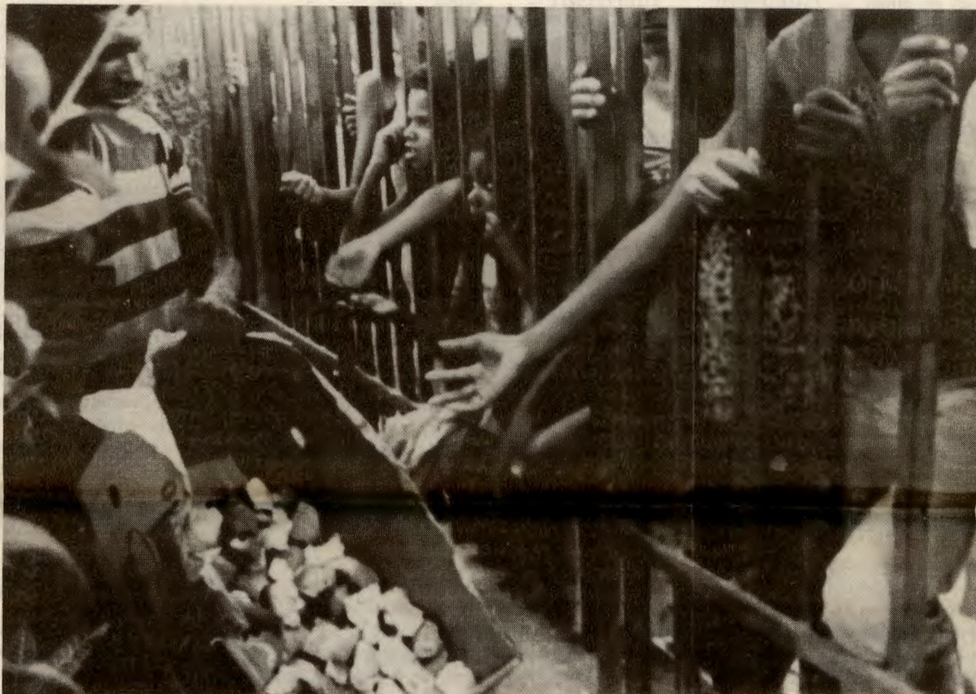
MAI-avtalen rammer det fattigste landene i sør hardest. Her fra et av Brasils mange slumområder

Dette er i beste fall skremmende naivt; i verste fall er det en total tilsidesetting av de forpliktelser Norge har inngått i forhold til miljø, Rio-konferansen og Agenda 21, og tilsidesetting av en rekke andre grunnleggende samfunnsmessige hensyn.