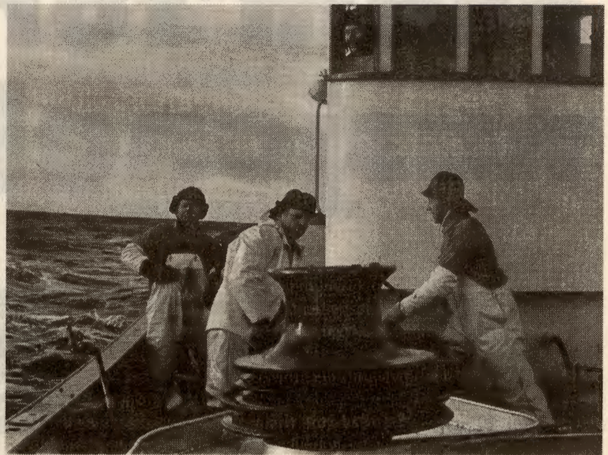
MAI fratrar lokalbefolkningen retten til å bestemme over sine ressurser.

MAI-avtalen vil gi mer makt til selskaper i Nord, på bekostning av folk og nasjoner i Sør. Utviklingsstrategier som har vært sentrale for utviklingen i Nord (som vern