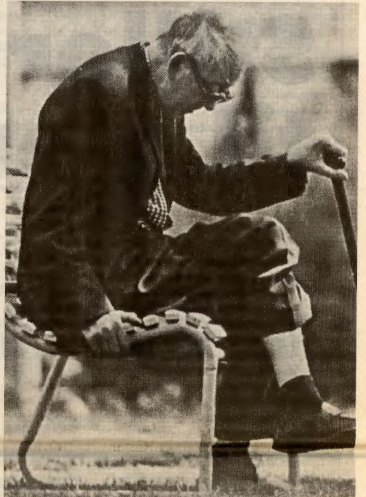
Kutt i kommuneøkonomien betyr kutt i velferden, og går hardest ut over de som trenger omsorg.

Spørsmålet er: orker RV å reise kampen, og å delta i den kampen folk reiser? Vi har ikke noe valg hvis vi skal unngå enda større nedskjæringer i et allerede hardt presset velferdstidbud i norske kommuner.