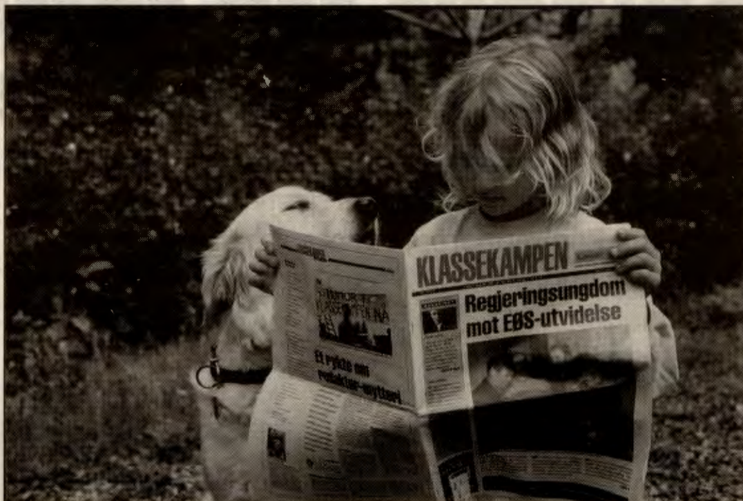
Verv nye abonnenter til Klassekampen!

Det fins to typer farlige tanker i samfunnet: Tanker som er farlige for oss, som holder motstanden nede, som tar fra oss trua på at det nytter å gjøre noe, som tuter oss øra og øya fulle med at det er andre som er viktige og at vi bare er utgiftsposter. At vi er for stygge. At en episode av yndlingssåpa di er viktigere enn å gjøre noe, osv. osv. Og så er det de tankene vi skal prøve å formidle gjennom Klassekampen. De tankene som