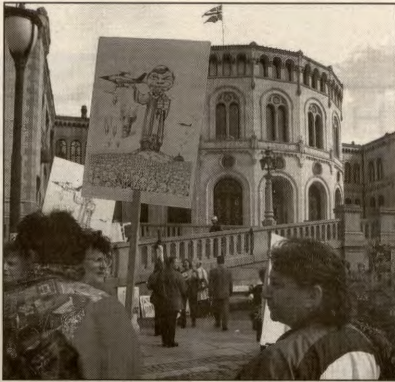
Protester mot norsk krigsdeltaking.