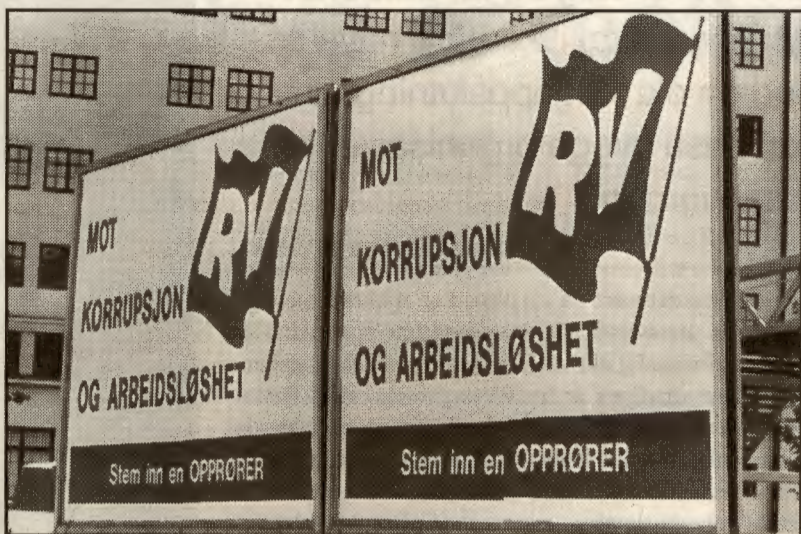
RV skal markere seg i valget til høsten, men hvordan?