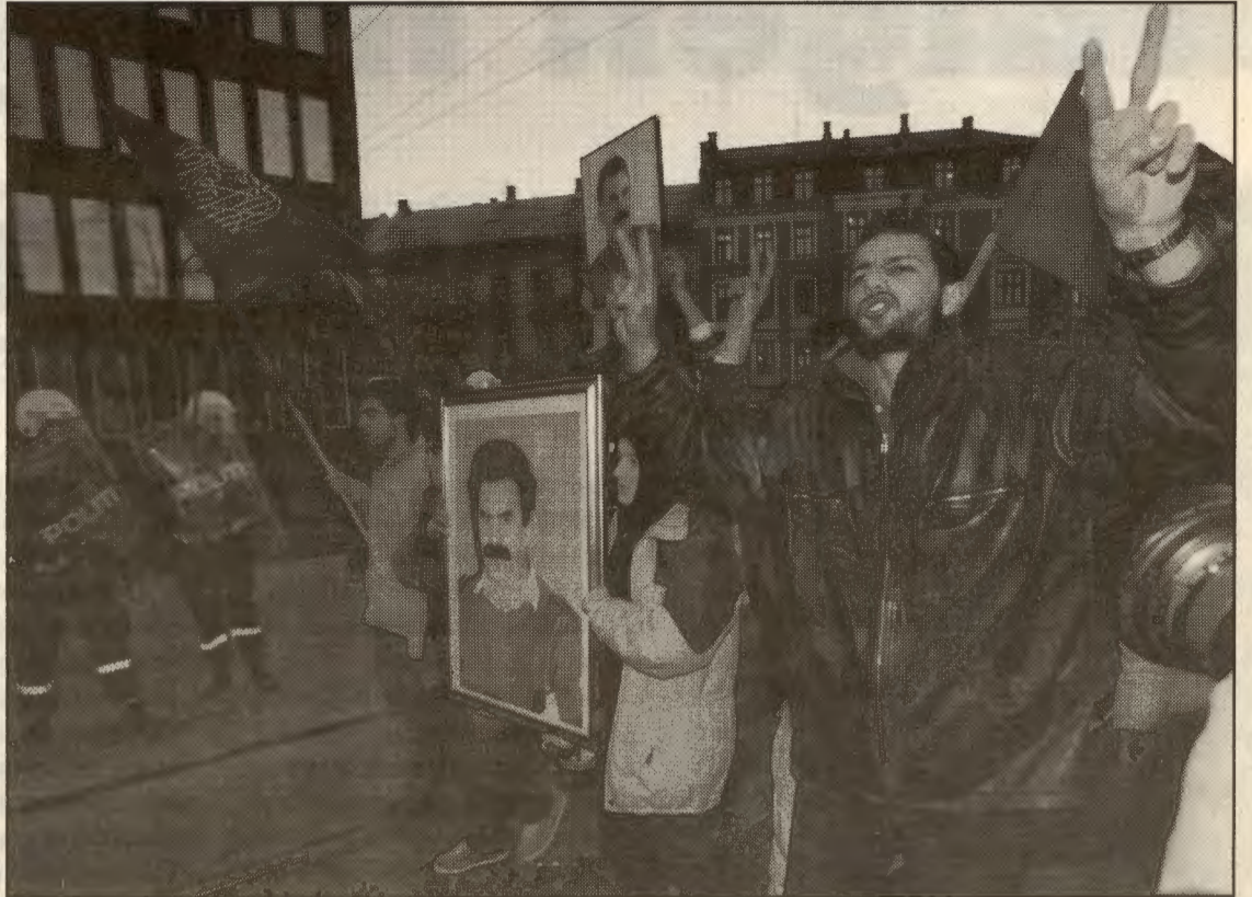
PKK-leder Abdullah Öcalan er i fengsel og kurdere over hele verden protesterer.