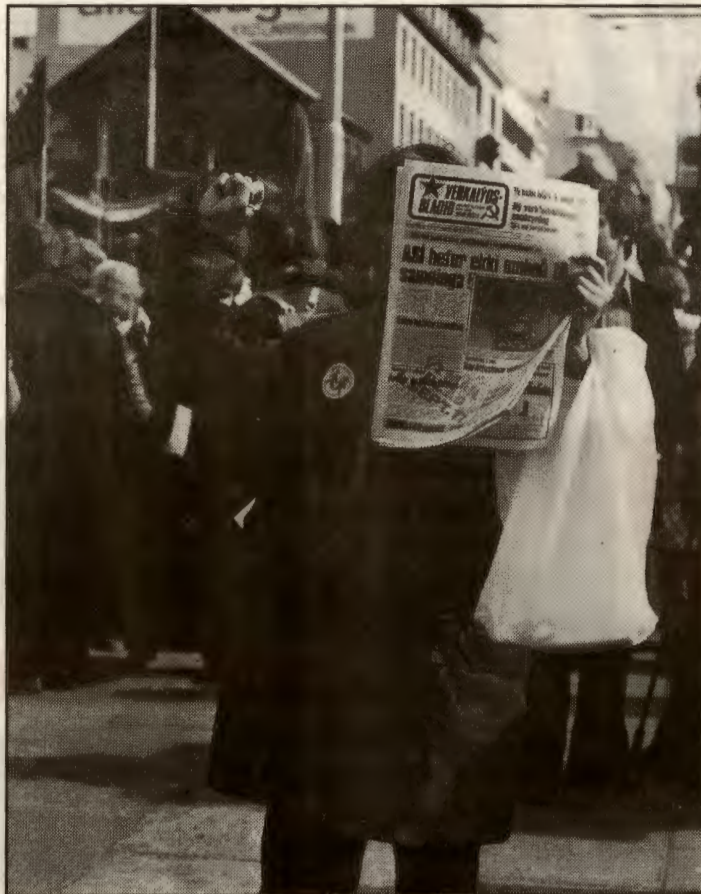
En ny venstreallianse fikk 9 prosent av stemmene på Island. Men hvem skjuler seg bak bokstavkombinasjonene? Svaret får du på side 6.