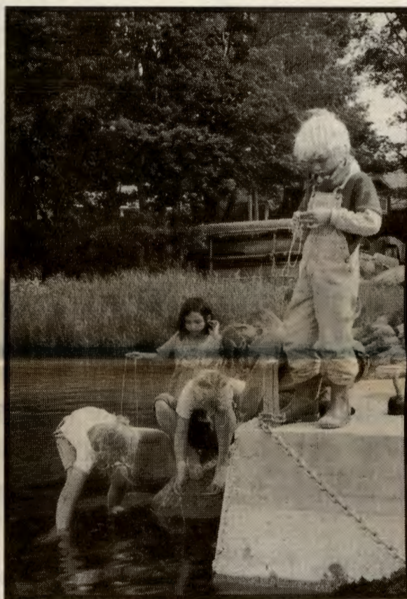
På sommerleir er det plass til både ungdom, pionerer og partiledere. Perfekt for de som vil kombinere spennende diskusjoner og trivelig ferie.