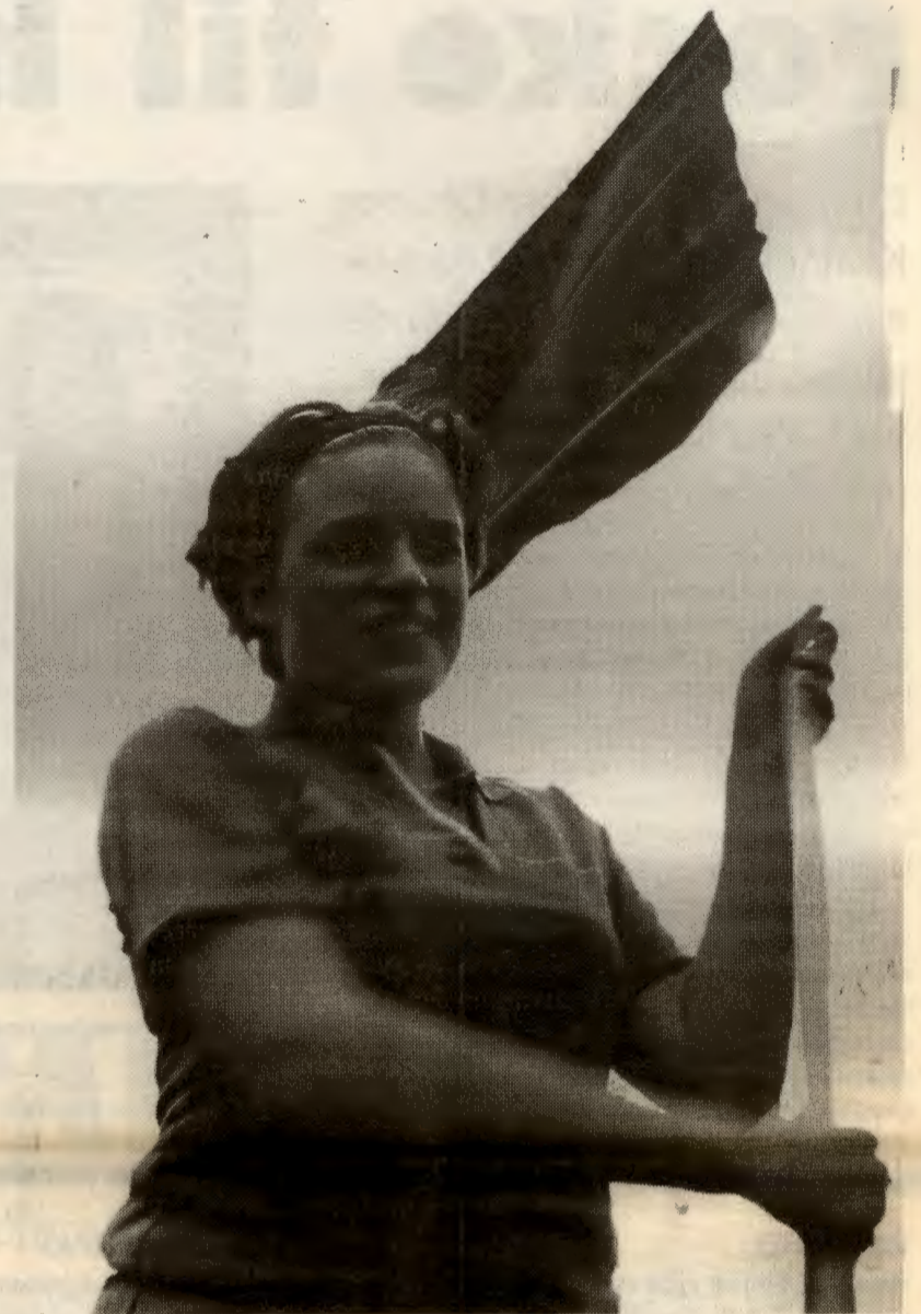
Nytt hefte fra Rød Ungdom – om sosialisme og folkestyre

Adresse: Osterhausgt 27 0183 OSLO tlf. 22 98 90 70, e-post: raud@ungdom.org