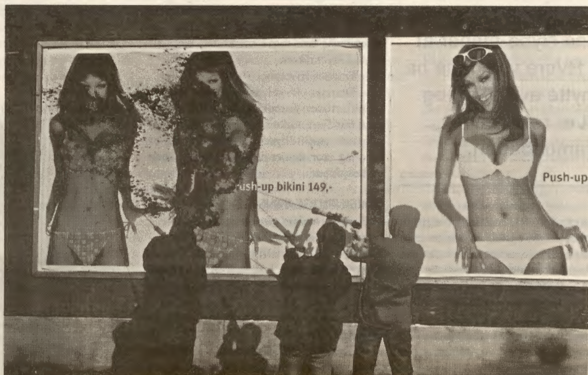
AMSAK dreiet seg mye rundt spraying av H&M-plakater, og ble andri noen organisasjon

Hver eneste jul og sommer kommer H&M med sine reklamekampanjer med syltynne frøknær, men det er ikke bare der vi får budskapet om at jenter skal se ut som et skjelett med silikonpupper. Det kommer på TV, i blader og i aviser. Hele tiden blir vi minnet på hvilken rolle vi skal spille – som attraktive for menn. Dette tar fra jenter selvillit og lar gutter bestemme hva som er deres verdi. Kampen mot skjønnhetstyraniet er kampen om å være mer enn