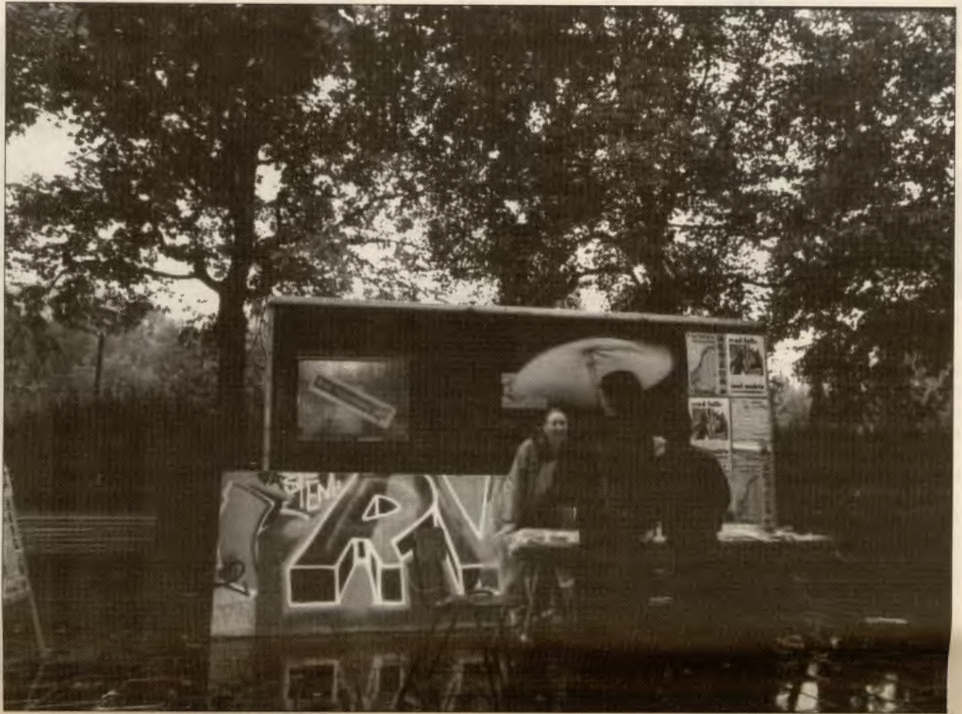
Det koster å drive valgkamp. Derfor er det viktig å holde lagsøkonomien i orden; RVs kontorleder forteller deg hvordan.

I første kvartal sender sentralen ut «tilbud om fornyelse av medlemskap» som er en pen måte å drive inn kontingent på, til alle som betalte kontingent iallfall ett av de to siste årene og som er medlem i lag med sentral kontingentinnkreving. Samtidig sender vi medlemslister til alle lokallag og fylkesledelsene. Hvis vi har færre medlemmer enn laget har notert selv, får vi gjerne en tilbakemelding. Ett unntak var i fjor, da noen lokallagsledere seilte ut av medlemslista fordi de ikke har betalt kontingent på flere år... Vi er litt spent på om de kom-