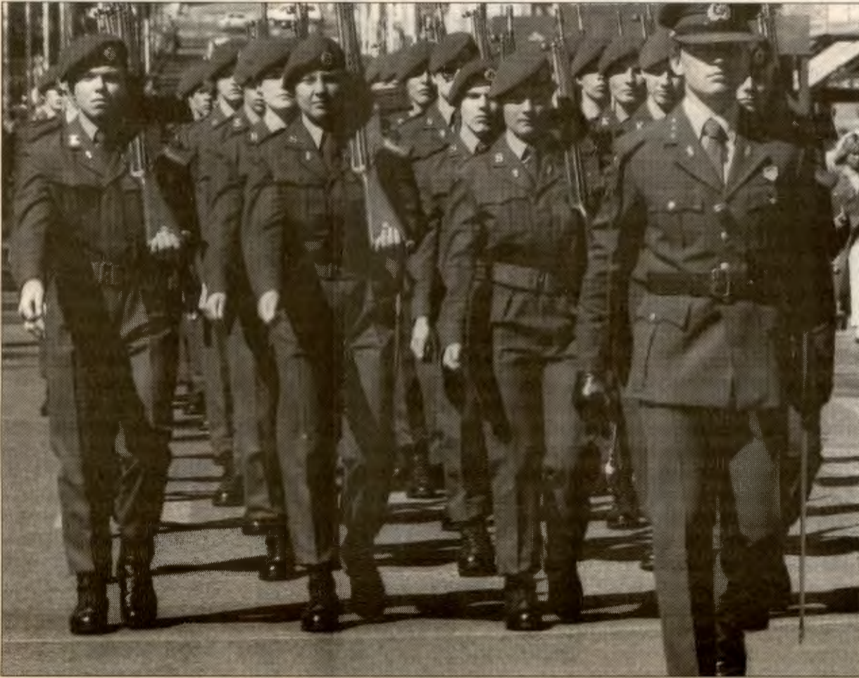
RVs syn er tradisjonelt å gå inn for et uavhengig nasjonalt forsvar basert på folkelig deltaking

ingen som reelt ligger etter verneplikt også for kvinner. Tvertimot er det slik at dagens vernepliktsordning legitimerer militæret under omleggingen. Da Telemark Bataljon først ble opprettet skapte det strid innad. Flere av offiserene var mot å kunne