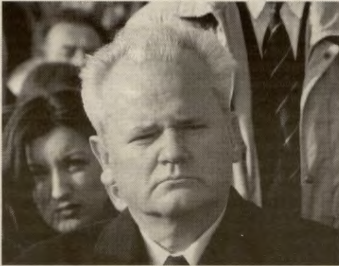
At arbeiderne kom på banen betød slutten for Milosevic.