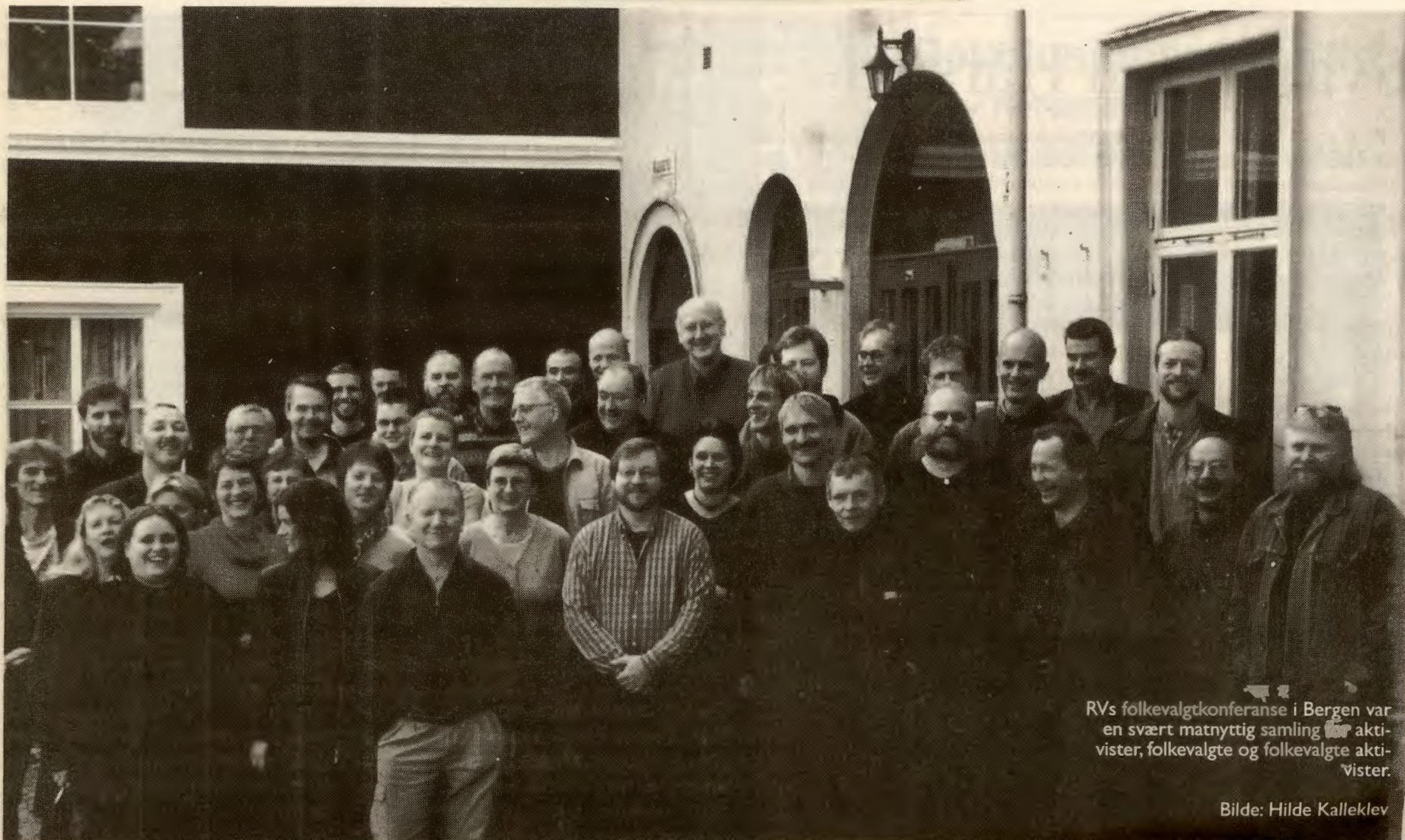
RVs folkevalgtkonferanse i Bergen var en svært matnyttig samling av aktivister, folkevalgte og folkevalgte aktivister.