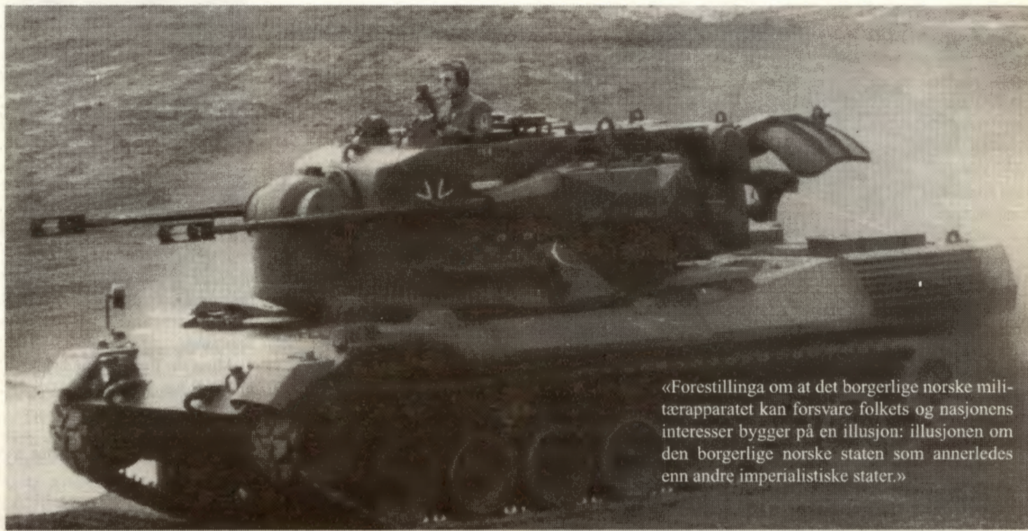
«Forestillinga om at det borgerlige norske militærapparatet kan forsvare folkets og nasjonens interesser bygger på en illusjon: illusjonen om den borgerlige norske staten som annerledes enn andre imperialistiske stater.»