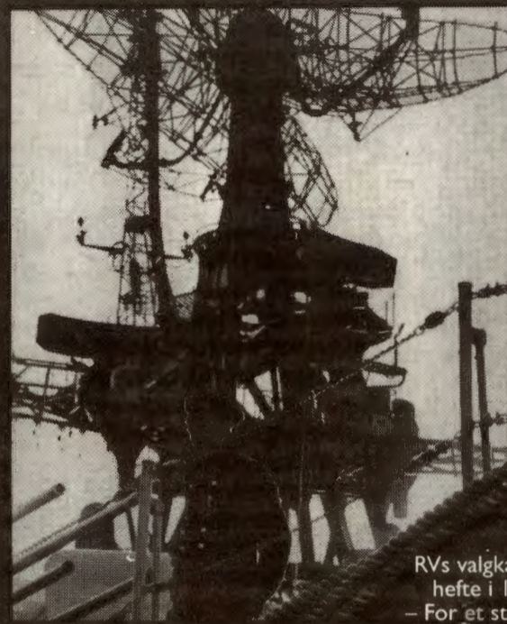
RVs valgkamphefte i 1981: – For et sterkt, uavhengig forsvar