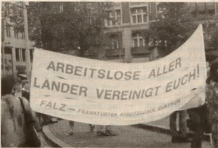
Parole under euomarsjen mot EU i Amsterdam 1997: «Arbeidsløse i alle land – foren dere».