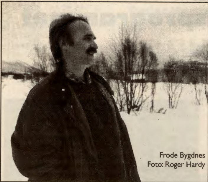
Frode Bygdnes