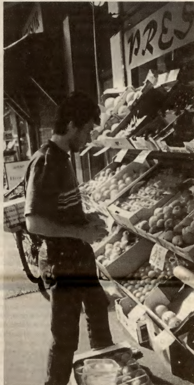
Arbeidsprogrammet forsøker å hankses med det flerkulturelle og flerreligiøse Norge.

Det siste kapitlet i programmet om demokratiske rettig-