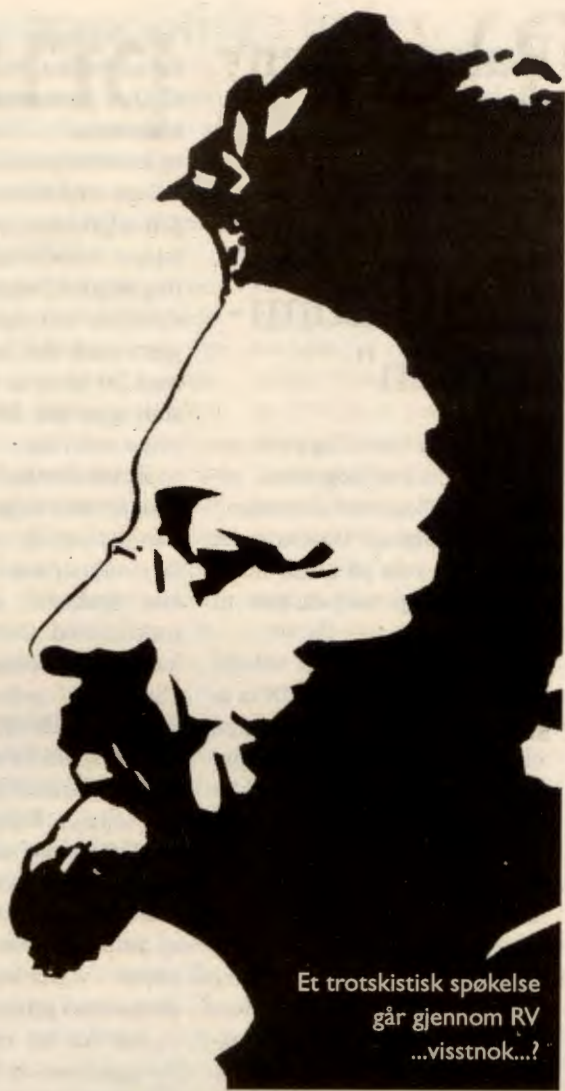
Et trotskistisk spøkelse går gjennom RV...visstnok...?

– Den største utfordringa i de to neste åra består i å gripe de nye mulighetene som åpner seg gjennom utviklinga i SU, SV-nettverket og IS. Hvis man sammenligner SU i dag med SU for fem år siden, ser man en ganske dramatisk utvikling. Tilsvarende med RU – deres uttalelse om sosialismens erfaringer er vesensforskjellig fra RU tidlig på nittitallet. I tillegg har frontene i SV blitt mye klarere gjennom etableringa av SV-nettverket. Også i IS er det nye og mindre sekterske toner. Disse mulighetene må RV gripe. Ikke gjennom organisatoriske påfunn, men gjennom å ta initiativer til felles aksjoner, ikke minst felles innsats for KK. Men vi må også utfordre SU, SV, SV-nettverket og IS politisk. Hvorfor støtter ikke SV-nettverket KK slik SU gjør? Mener SU at RV er en del av den "udemokratiske venstresida"? Hvorfor kaster ikke IS kreftene inn i arbeidet for å få revolusjonære på Tinget? I dag er vi i RV altfor lite offensive overfor andre på venstresida. Mange i f.eks. IS ville lytte til en fornuftig kritikk av sektersismen deres. Denne passiviteten er et hinder for å samle aktivistmiljøene på venstresida i et parti.