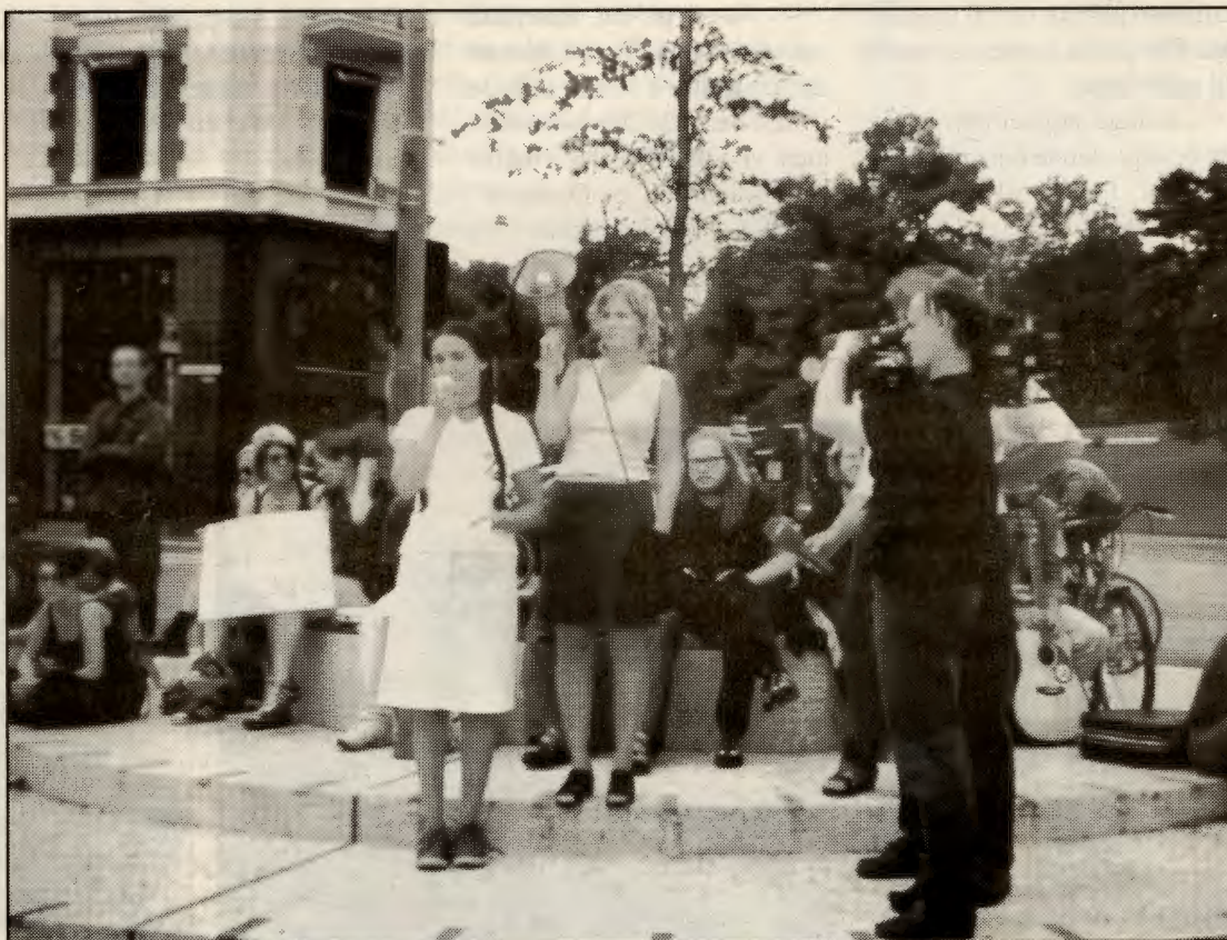
Attac og Slett U-landsgjelda demonstrerer i Oslo mot G8-toppmøtet, samtidig med 200.000 mennesker i Genova. RV stiller til valg med et klart budskap om at en annen verden er mulig.

Oslo RV har valgkampkontor i Osterhausgata 27. Tlf.nr. er 22 98 90 58. Kontortid og andre praktiske opplysninger vil bli offentliggjort i Klassekampen og på nettsidene underveis.