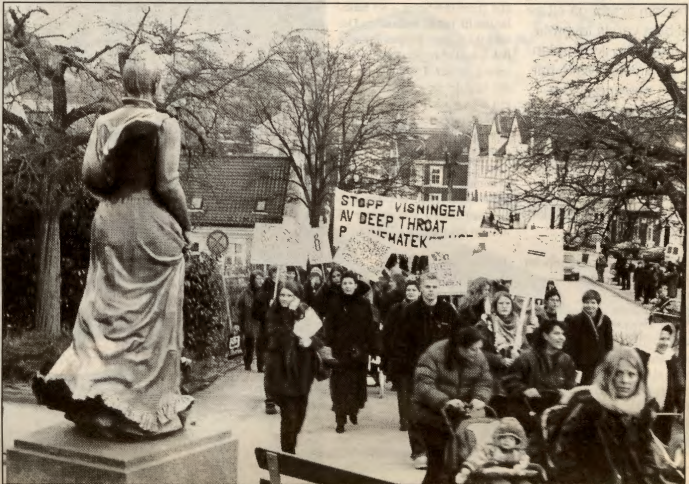
Hvis RV kommer på stortinget er det fortsatt aksjoner og folkelig mobilisering som er avgjørende.