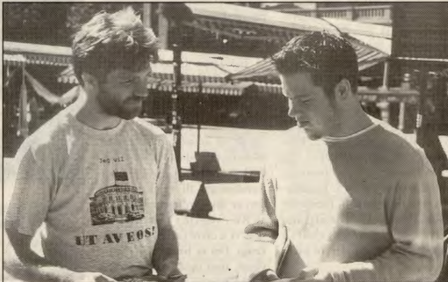
Som en av landets første delte Opprør-redaktøren ut brosjyrer på Youngstorget. – Folk tar godt imot dem, forteller han.