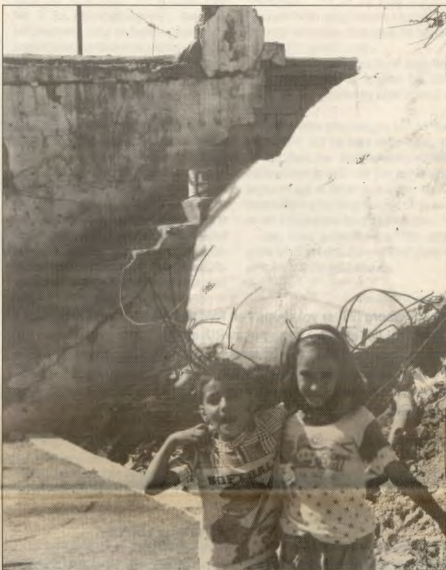
Militariseringen av intifadaen rammer særlig barn og kvinner.

Men uenigheten er stor, og det følgende motsvaret er langt fra atypisk: "Ikke-vold som en alternativ motstandsform er dømt til å mis-