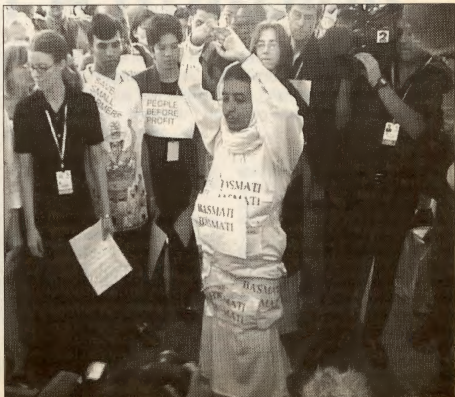
Fra en av de mange markeringene til frivillige organisasjoner under WTO-møtet i Doha, Qatar. Denne aksjonen satte søkelyset på hvordan selskaper i Nord tar patent på planter i utviklingsland, og hvordan fattige bønder gjøres avhengig av storselskapene.

Nettverksmøtene er en møteplass hvor organisasjoner som Nei til EU, RV, SV, Senterpartiet, Natur og Ungdom, Bonde- og småbrukerlaget, Nettverk mot markedskraft,