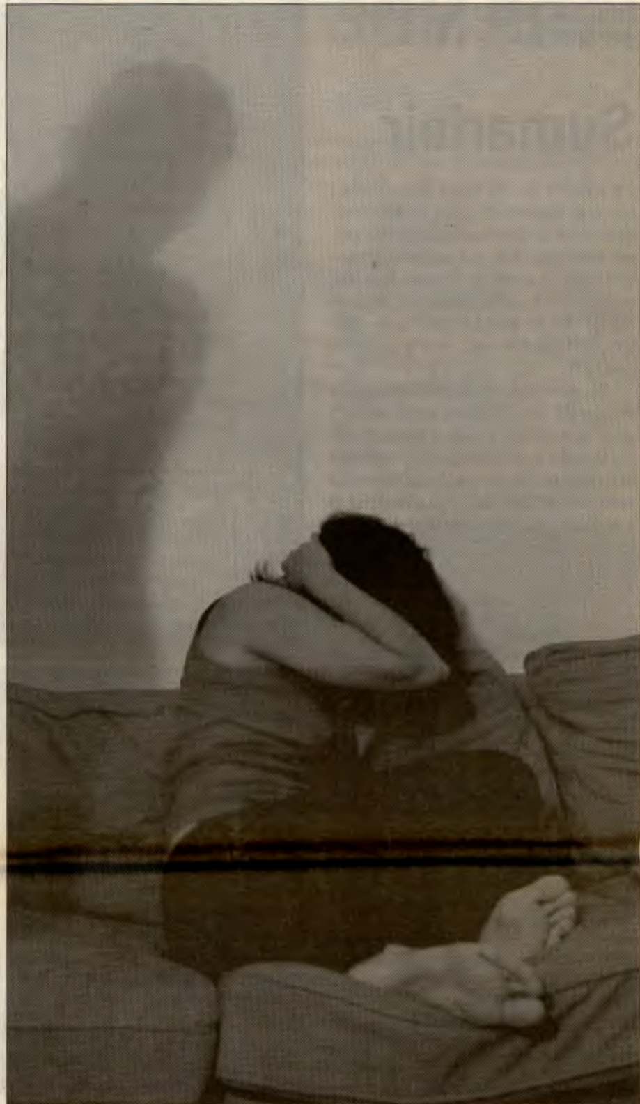
Artikkelforfatteren mener politiet ikke gjør jobben sin i saker om kvinnemishandling og drap. Hun kommer med forslag til krav RV bør reise.

3. Kvinnemishandling på pensum på Politihøyskolen! I dag vet den jevne politibetjent skremmende lite om kvinnemishandling. Når vi holder infooppdrag for politistudentene, er det ofte første gang politistudentene hører om krisesentrene og krisesenterbevegelsen. Kvinnemishandling omtales fortsatt som "husbråk", og bagatelliseres av mange politibetjenter. Kvinner som anmelder mishandling, opplever ofte å ikke bli trodd av politiet. Påføring av skyld og skam, uvettige kommentarer ("det er alltid to sider ved en sak", "det tar to for å krangle" etc.) og generelt klønete oppførsel fra politibetjentene fører til