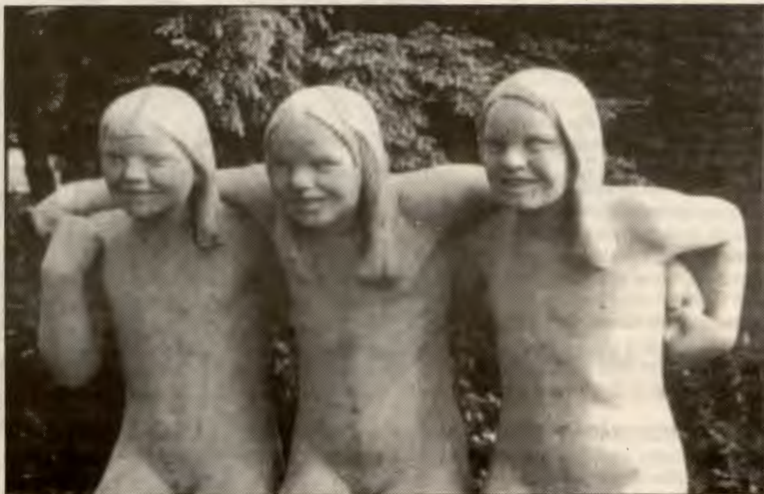
Jenter i RV står sammen.

I tråd med mandatet til Kvinneutvalget har det enkelte kvinneutvalgsmedlem fått i oppgave å være kvinnepolitisk koordinator for ulike fylker. Dette innebærer at det enkelte medlem må ta kontakt med fylkesleder/lagsleder og si at de kan kontaktes hvis de ulike lag trenger