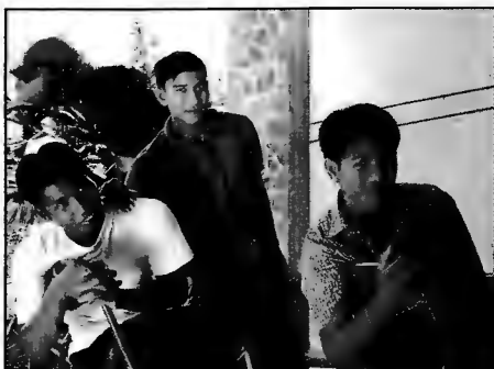
ØKONOMISTUDENTER: Tre av gutta i Battambang.

Fattigdommen fører til at folk må dra lenger og lenger ut i ubebodde områder for å dyrke jord, selv om de ikke aner hvor det kan ligge miner. Korrupsjonen gjør det også mulig for de med makt å ta jorda til fattige. Generaler i militæret kunne plutselig skaffe et papir hvor det stod at