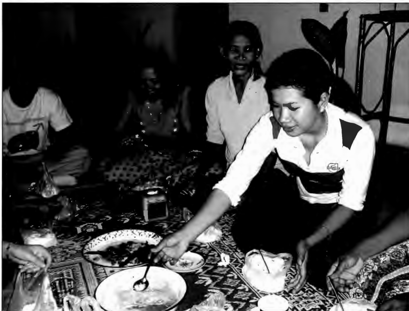
JORDMORBESØK: Tradisjonell middag med noen av jordmødrene i Sampov Loun.

På grunn av minene ligger mye av jorda brakk. I tillegg er området er mye tørrere enn andre deler av Kambodsja fordi all regnskogen er blitt hugd ned og ulovlig eksportert til Thailand. Det gjør at området er fattig, fordi størstedelen av Kambodsjas befolkning lever av å dyrke ris og bønner.