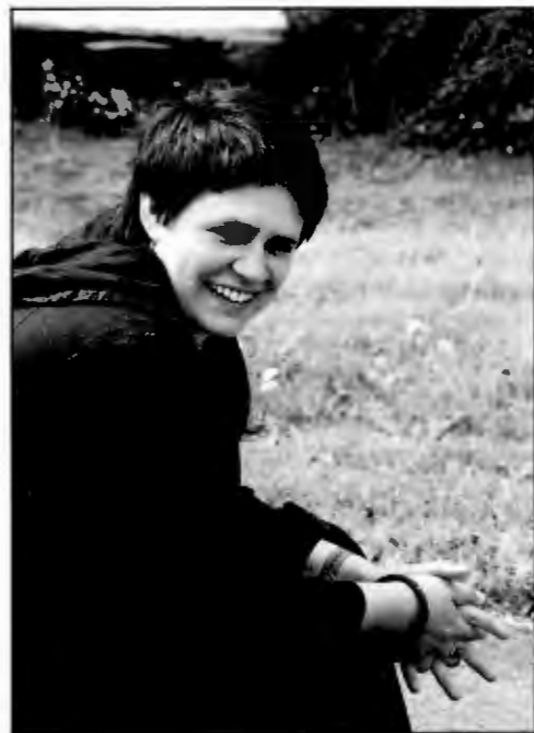
OPTIMIST: Marte Mjøs Persen gleder seg til Stortinget.