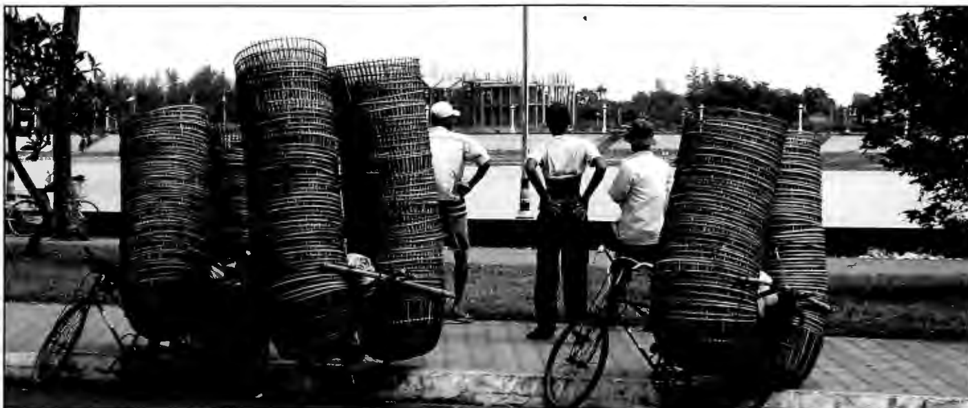
BALANSEKUNST: Syklende kurvselgere i Phnom Penh.