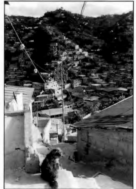
BARRIO: En hund kikker ned over en barrio - en fattig bydel.

Mens Vatikanet følger strenge regler for hvem som skal opphøyes til helgener, foreløpig har ingen fra det latinamerikanske kontinent oppnådd dette, er det ingen som kan forklare akkurat hvordan helgener blir til i Venezuela. Det antropologer og sosiologer er enige om, er at til tross for pavekirkens kamp mot disse trosretningene, har disse tradisjonene en imponerende overlevelsessevne. I forhold til den enorme utbredelsen er det gjort