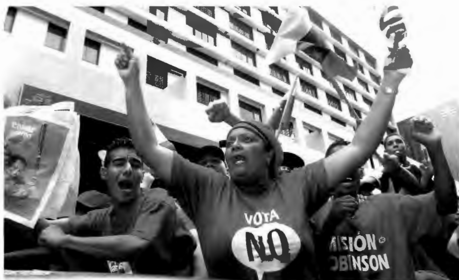
STEM NEI: Demonstrasjon til støtte for Chavez, da opposisjonen i 2004 samlet inn nok stemmer til et tilbakekallingsvalg. Demonstrantene oppfordrer folk til å stemme nei til tilbakekalling.

Hovedpunktet i Chavez' utenrikspolitikk er at dagens verden er multipolar. Derfor prioriterer Venezuela økonomiske forbindelser med nasjoner og regioner som potensielt utgjør en motvekt til USAs hegemoni: Kina, Russland, India og den arabiske verden. Mer direkte politisk er strategiske partnerskap blant annet med landene i Latin-Amerika. 14. februar 2005 ble en slik allianse signert med Brasil,