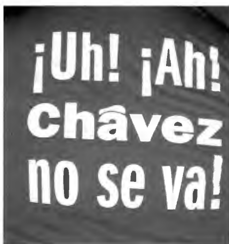
CHAVES BLIR!: T-skjorta i demonstrasjonen har et klart budskap: Chavez blir!