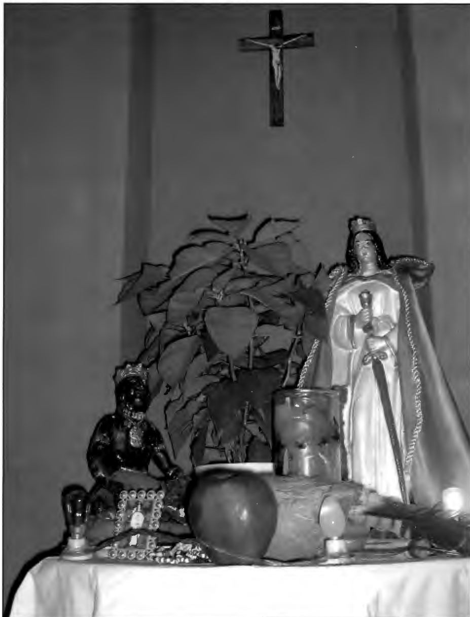
BESKYTTELSE: Et "santerio", av typen som mange har i hjemmene sine. Der er Chango, den svarte, som er en figur basert på en gammel yoruba-heltemyte og opphøyd til helgen i santeria, og Santa Barbara til høyre. Rundt figurene ligger forskjellige gaver til disse helgene: epler, sigarer mm, for at disse skal beskytte hjemmet.

En liknende skjebne ventet landets urbefolkning. Blomstrende samfunn eksisterte fra Andesfjellene i vest til den karibiske kysten i nord og øst og Amazonas-regionen i sør. Med unntak av enkelte små samfunn som utgjør mellom en og to prosent av befolkningen, er Venezuelas indianere i dag utryddet. Når man i tillegg tar i betraktning den intense amerikaniseringen, som har funnet sted i landet spesielt de siste 30 årene er det nærliggende å avskrive den åndelige arven fra de afrikanske slavene og indianerne, som død eller døende. Og ganske riktig, slår man opp i et moderne leksikon, finner man at det overveldende flertall bekjenner seg til den katolske kirke, mens mindre protentantiske, jødiske og i senere tid også muslimske trossamfunn utgjør resten av det religiøse spekteret. Med andre ord, akkurat som et hvilket som helst annet sør-europeisk land. Inntrykket bekreftes også av den dominerende posisjonen til katolisismen i det offentlige rom, både fysisk, representert ved de mange kirkene