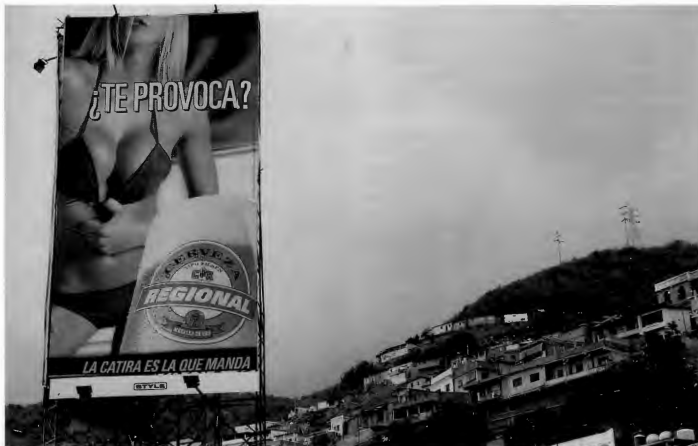
PUPP FOR ØL: Til tross for Chavez, det er fortsatt langt igjen før kvinner kommer ut av objektrollen i Venezuelas offentlige rom.