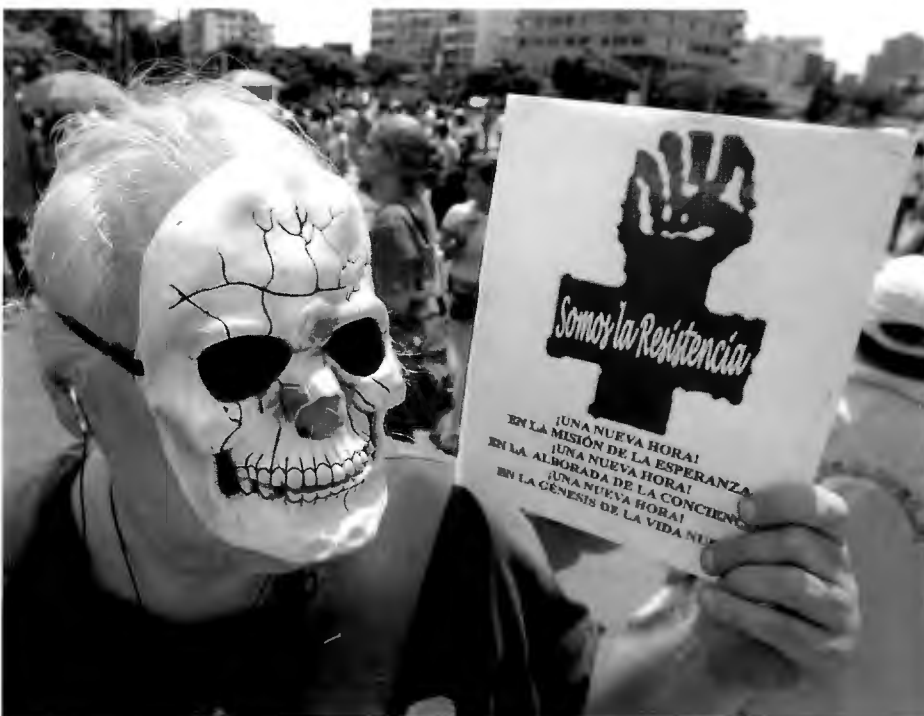
OPPOSISJONEN MOT CHAVEZ: En demonstrant mot Chavez landreformer holder en plakate med påskriften «Vi er motstanden», Caracas 25. september 2005.

* Den Fjerde Republikken – systemet til Punto Fijo – er perioden fra 1958 fram til den nye konstitusjonen fra 1999 som markerer grunnleggingen av den bolivarianske republikken i Venezuela.