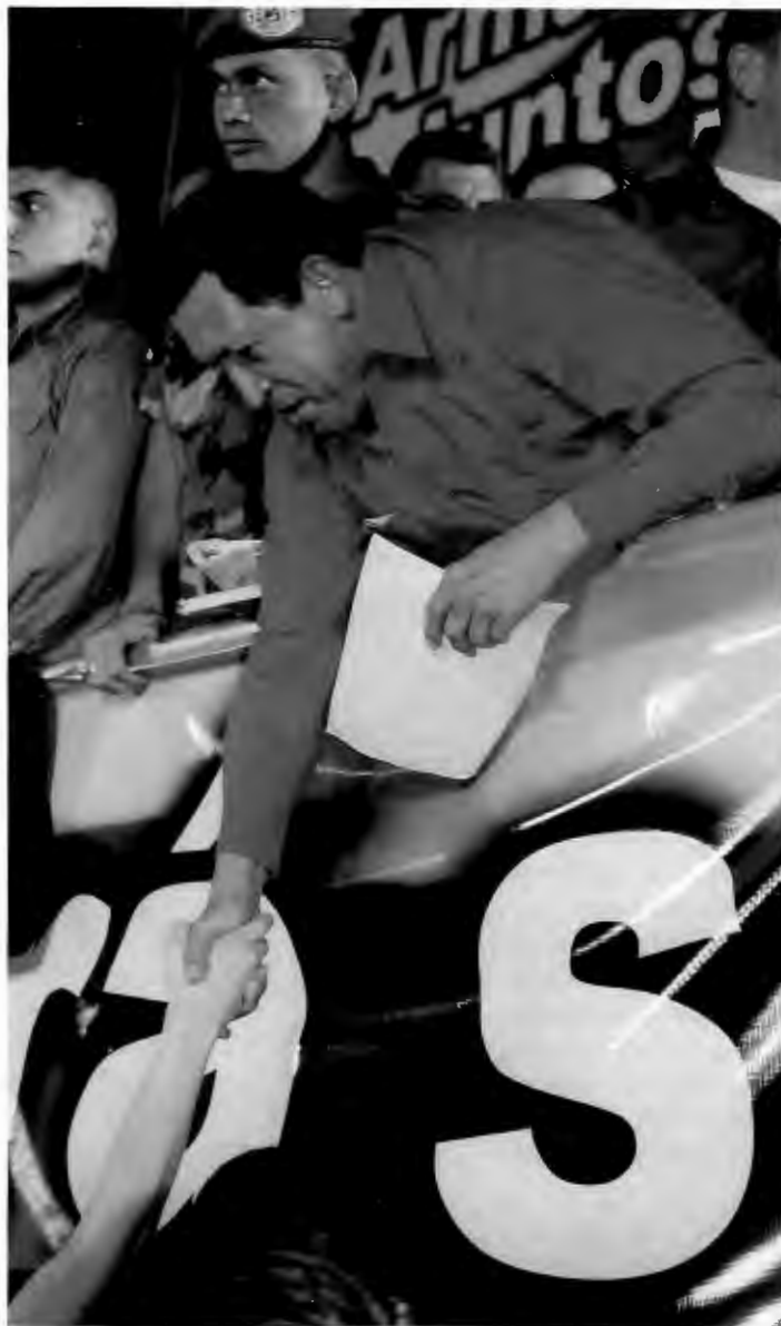
MOTVEKT TIL USA: Venezuela og Chavez må syne at utviklinga i landet kan bety noko for alle i Latin-Amerika som ikkje vil underleggje seg USAs nye handelskolonialisme.

Demokrati på Amerikansk vis Eit hovudargument for avtalen i USA har vore at den vil sikre demokratiet i regionen. Det