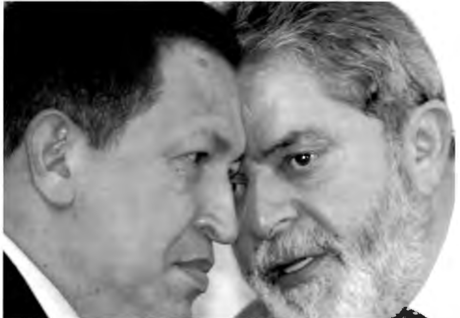
ALLIESTE: Lula og Chavez i konsentrert samtale. USA legger press på Lula til å ikke støtte Chavez.

Gjennom sabotasjen av oljeindustrien senhøstes 2002 og tidlig 2003 fikk folkelig aktivisme et oppsving. Men samtidig er det et paradoks at den stabile økonomiske situasjonen i Venezuela både styrker den bolivarian-