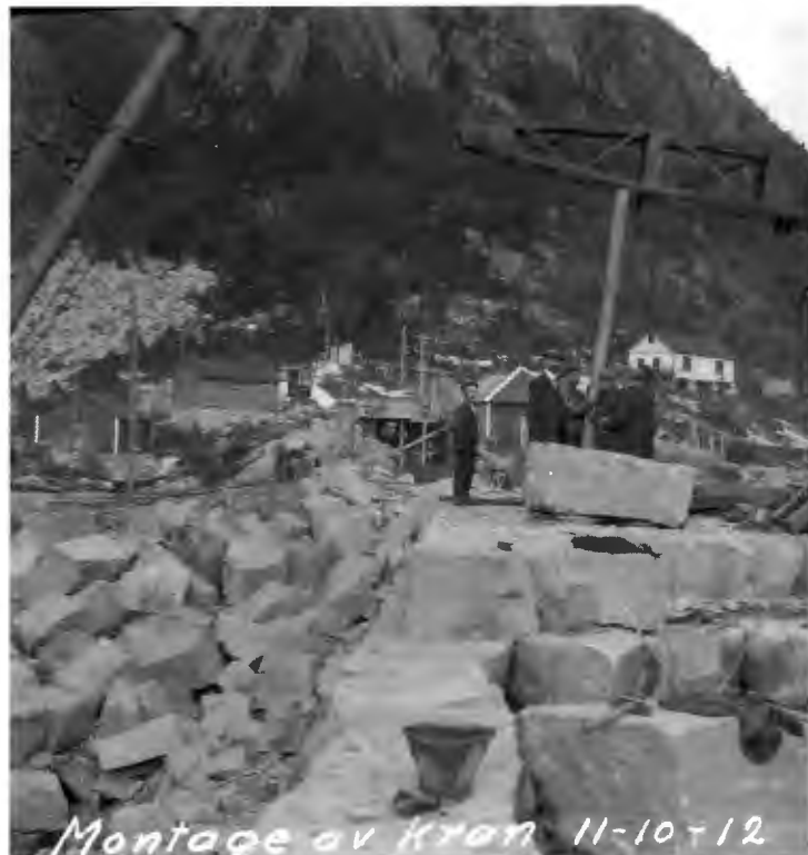
RALLAREN HADDE GRANITT I GENENE: Folk i arbeid på den samme demningen (Ringedalsdammen) i 1912.

Men dette er òg ei bok om tekniske nyvinningar og om ingeniørar som trossa gamle dogme og gjennomførte dristige løysingar. Til og med di-