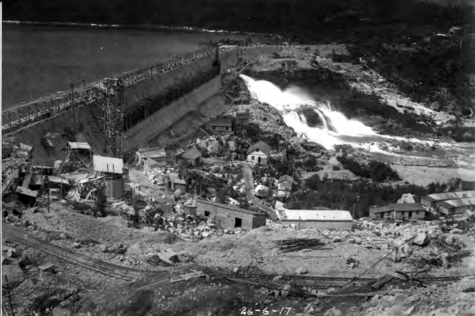
DEN STORE DEMNINGEN I SKJEGGEDAL: Temmingen av fossene la grunnlaget for den norske velferdsstaten. Bilde fra 1917.