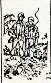
«Vel, er det noen annen måte å hindre dem fra å bli kommunister?»

OPP TIL Å SLÅ NED SOSIALT INDRER OPPROR, SPANIA ER GJENNOM AVTALER MED USA LIKESTILT MED NATO-LANDENE. NÆRMERE OM DETTE, SE DAGBLADET 16. JUNI 1969. UNDER "MAIREVOLUSJONEN" I FRANKRIKE I 1968 BLE FRANSKE NATO-AVDELINGER SATT INN I DIREKTE KAMPHANDLINGER MOT STREIKEBRYTERE OG STUDENTER. I DET FORELA PLANER OM HVORDAN ANDRE LANDS NATO-STYRKER KUNNE SETTES INN DERSOM DE FRANSKE IKKE ALENE KUNNE SLÅ NED DET FRANSKE FOLK. I 1970 BLE ENGLISKE TROPPER BRUKT SOM STREIKEBRYTERE UNDER NOEN AV DE STØRSTESTRIKENE, EN "FREDLIGERE" MEN LIKE FÄRLIG METODE I KAMPEN MOT FOLKET. I NORGE FÄR DELER AV MILITÄRPOLITIEF OPPLÆRING I HVORDAN DE SKAL KUNNE KONTROLLERE OG SPLITTE STORE FOLKE- MENDER UNDER F. EK. DEMONSTRASJONER, OG SIVILT RESERVEPOLITI FÄR LIGNENDE OPPLÆRING I MILITÄRLEIRE. DETTE ÅPNER MULIGHETEN FOR AT MILITÄRE OG HALV-MILITÄRE ENHETER OGSÄ I NORGE KAN SETTES INN MOT STREIKENDE ELLER DEMONSTRERENDE FOLKEGRUPPER.