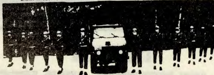
Militærteknisk formasjon for splitting av ulovlige demonstrasjoner". Offentliggjort i "Kontakt med høren".

MAN KAN IKKE FORSVARE YTRINGSFRIHETEN MED KANONER OG MILITÆR DISIPLIN. NETTOP AKTIV BRUK AV YTRINGSFRIHETEN KAN VÆRE ET VIKTIG KAMPMIDDEL. DEN ILLEGALE PRESSE HAR VERT VIKTIGE FORSVARS- MIDLER I MANGE MOTSTANDSKAMPER.