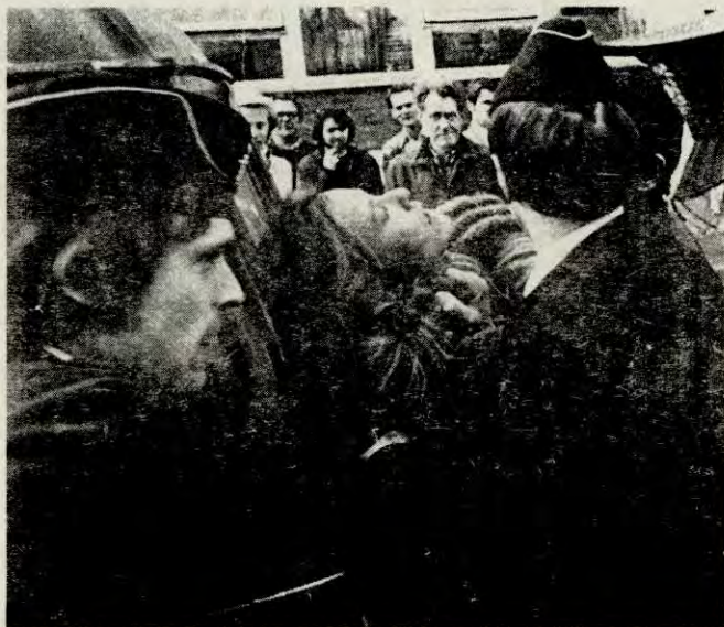
Lugging og strupetak var blant de råtne metodene politiet brukte mot fredelige demonstranter og arbeidere!

100 blad og prisen er kr.50,- pr. stk. Vi oppfordrer folk til å skaffe seg dette kunstverket. Hele beløpet går til Linjegods-arbeiderne. Plakaten blir sendt pr.oppkrav fra oss og betaling for emballasjen kommer derfor i tillegg.