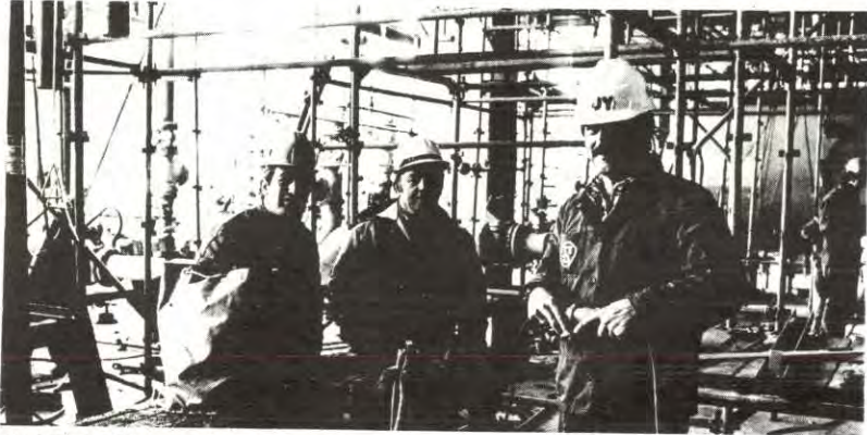
BILDET: Arbeidere på Rafnesanlegget.

Den sit-down streiken som de 110 arbeiderne ved Norcon/Rafnes nylig gjennomførte mot tariffstridige og høyst ulovlige oppsigelser av 14 arbeidskamerater endte med full seier. Streiken tok til tirsdag 30. august og i slutten av samme uken måtte bedriften innfri kravet om gjeninntakelse av de 14 arbeiderne. I tillegg så fikk arbeiderne gjennom 30% lønn for den tida de var i streik.