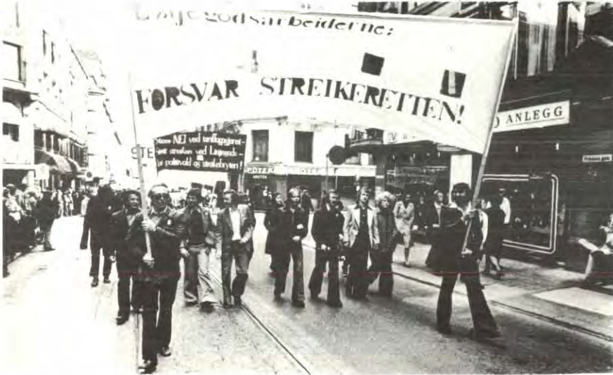
Bildet: Linjegodsarbeidere som demonstrerer for streikeretten.

Den nåværende høye arbeidsytelsen vil bli satt ned på de områder som bonusavtalen omfatter, bl.a. måling av gods.