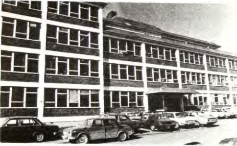
BILDET: EBs avdeling i Østensjøveien i Oslo.

I boka nevnes det også at de oppsagte kommer til å gå til rettsak for å få jobbene tilbake: "Vi har bestemt oss for å gå til sak mot bedriften og noen av streike-