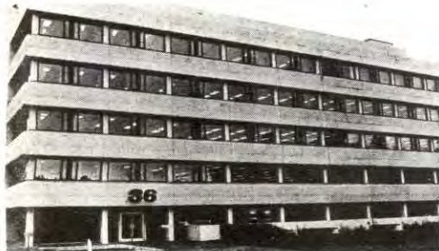
BILDET: Norma Prosjekttilfabrikk i Oslo.

Onsdag 31. august ble en arbeider ved Norma Prosjekttil i Oslo sagt opp på politisk grunnlag. En advarsel som arbeideren fikk fra bedriftsledelsen uka før forteller mye om hva som ligger bak oppsigelsen.