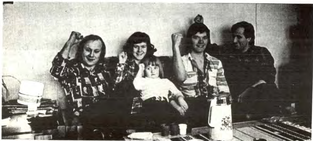
Bildet: Tromsfiskarbeidere som gikk i spissen for fagorganisering.