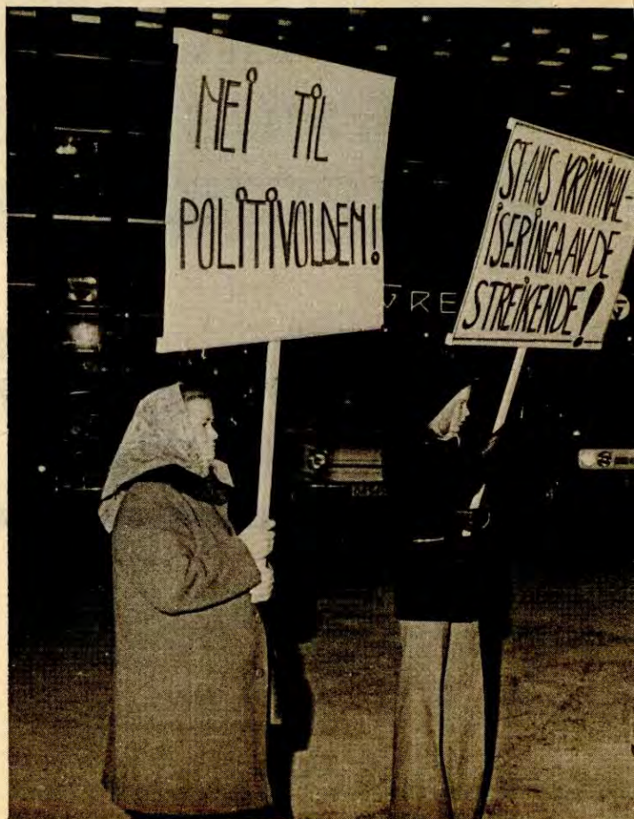
En del av de streikende under en demonstrasjon.