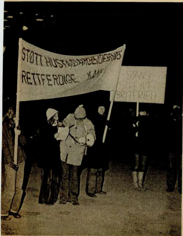
aksjon i Trondheim torsdag 2. desember