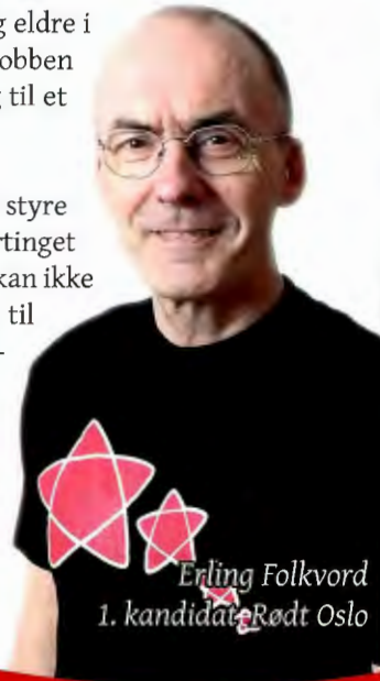
Erling Folkvord 1. kandidat Rødt Oslo

Rødt vil snu prioriteringene. Det er menneskenes behov som skal styre omsorgsbudsjettene, ikke omvendt. Det er ikke mulig uten at Stortinget gir kommunene en kraftig og varig inntektsøkning fra 2010. Ellers kan ikke eldre i Oslo føle seg trygge på at de vil motta den omsorgen de til enhver tid har behov for og sykehjemsplass når det trengs. På Stortinget vil Rødt også foreslå å fjerne egenandelene i helsevesenet, også for tannhelsetjenester. Men de eldre skal ha mer enn bare en seng å ligge i. Derfor vil Rødt bygge ut eldresentre med kultur og undervisningstilbud i alle kommuner. Bare det beste er godt nok for våre besteforeldre.