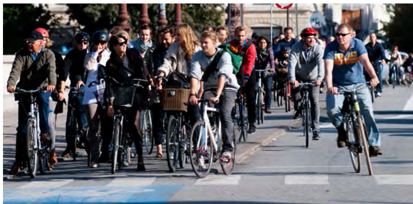
Kan København, kan vi!